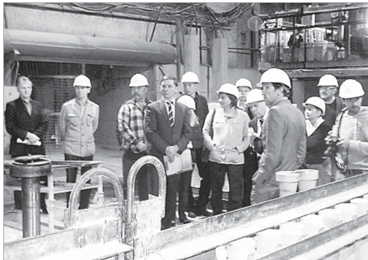
Городские общественные инспекторы оценили природоохранную деятельность «ДИНУРА». Лето 2012 года.

звана «ДИНУР: рубежи настоящего». В ней — обзор трудовых будней завода за минувшее десятилетие. 14 апреля прошёл концерт, приуроченный к 10-летию хора Совета ветеранов «Россияне». 18 мая в зале ДК собрались выпускники динасовской