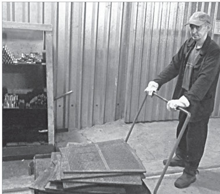
Оборудованные в механолитейном рельсы с тележкой стали большим подспорьем, в том числе, и для термистов.

Когда, наконец, дошла очередь до внедрения этого новшества, решили сами выполнить работу, а для минимизации затрат пустили в дело металлолом. С тем, чтобы обустроить проём в стене, бетонную дорожку, железнодорожные пути, изготовить тележку, справилась цеховая бригада под