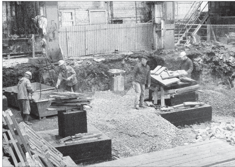
В первом цехе начинается строительство линии по производству крупногабаритных изделий. Осень 2011 года.