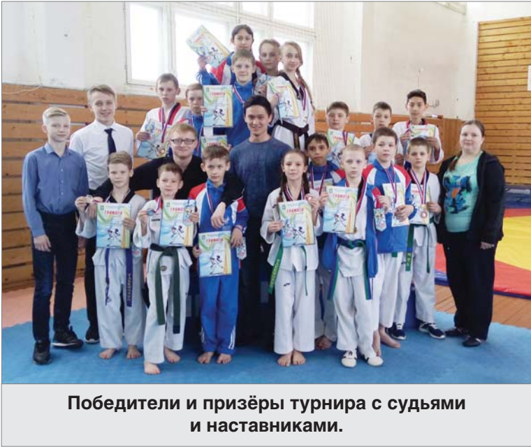
Победители и призёры турнира с судьями и наставниками.