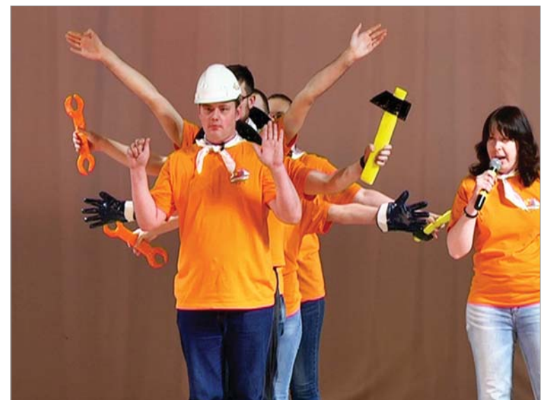
На сцене — агитбригада Невьянского цементного завода.

Главный приз конкурса получили две команды — студенческая агитбригада Пермской сельхозакадемии и агитбригада нижнетагильского профсоюза работников культуры. У команды Первоуральского динасового завода — приз в номинации «Лучшая пропаганда профсоюзного движения». Новотрубников жюри отметило за оригинальность в раскрытии темы.