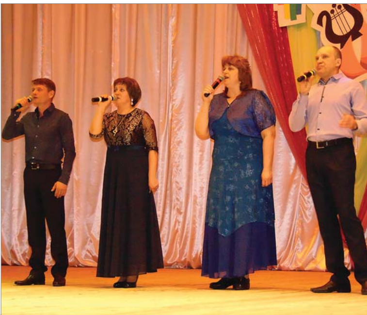
Квартет цеха №2 с авторской песней «Шире круг».