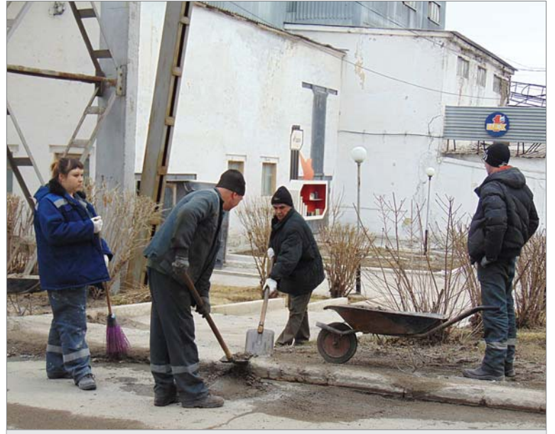
Порядок наводят работники цеха №1.

В числе первых, как только сошёл большой снег, динуровцы приступили к генеральной уборке территории предприятия. Чистят дороги, пешеходные зоны, убирают старую листву. Для каждого цеха подробно расписан объём работ, которые необходимо выполнить в период генеральной уборки. Рудничанам, например, предстоит навести порядок на площадке отгрузки кварцита, очистить от веток газон полубункерного склада, упорядочить складирование запасных деталей на открытых площадках участка дробления, сортировки и обогащения... Строителям — упорядочить хранение пиломатериала, поддонов, восстановить нарушенное ограждение