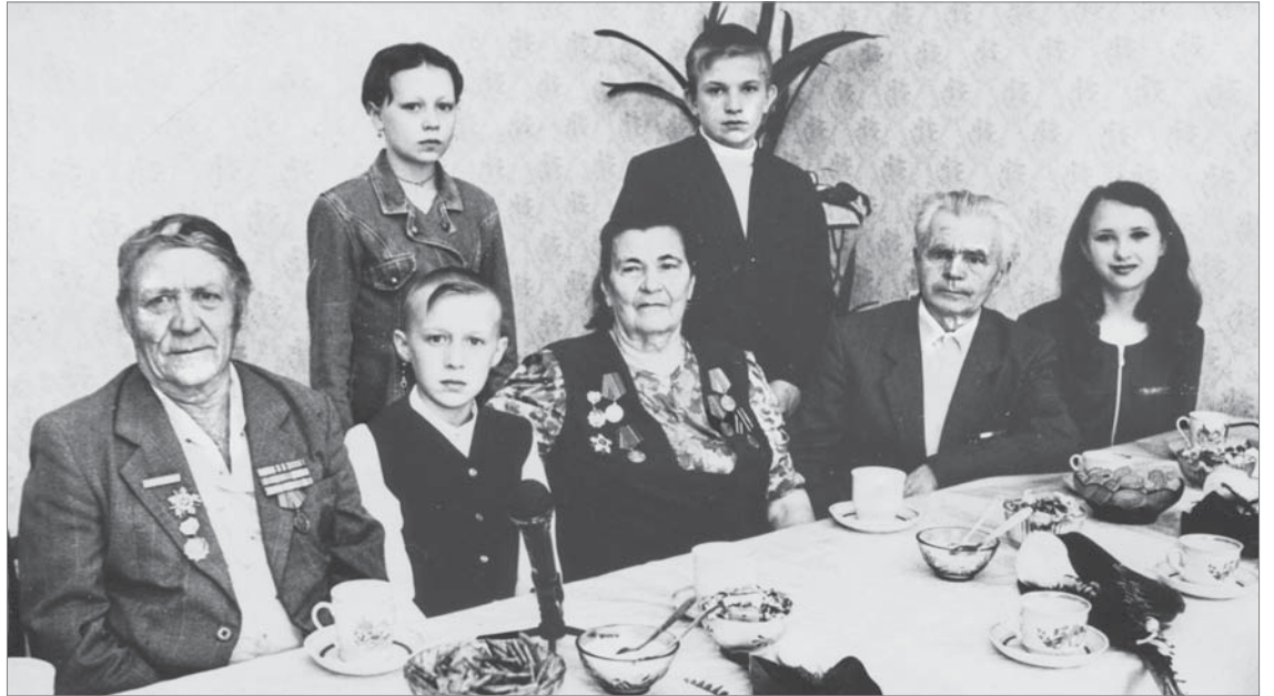
Встреча школьников и ветеранов накануне 9 Мая 1999 года.

Всё, что полагалось бывшим работникам завода, проживающим здесь, мы везли и в Верхнюю Пышму – после закрытия