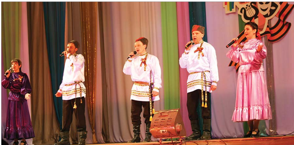
Фестиваль народного творчества, посвящённый 70-летию Победы, 2015 год. На сцене – коллектив цеха №2.