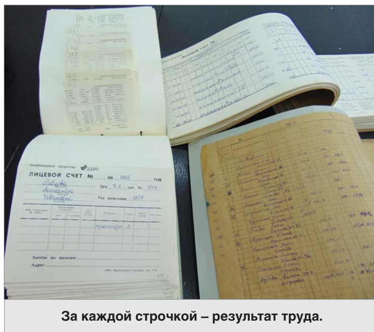
За каждой строчкой — результат труда.

размашистым почерком: «Справка ООТ: по цеху 1 перерасхода нет».