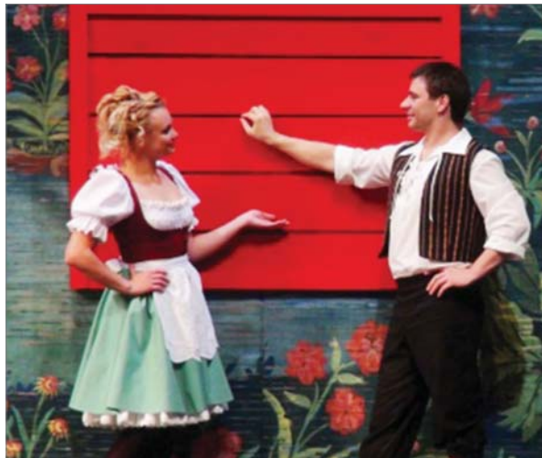
Фрагмент из спектакля «Безумный день, или женитьба Фигаро».

- Года два назад был с ребёнком на детском спектакле в Казахстане, когда был в отпуске. Считаю, что в театр ходить необходимо за новыми впечатлениями.