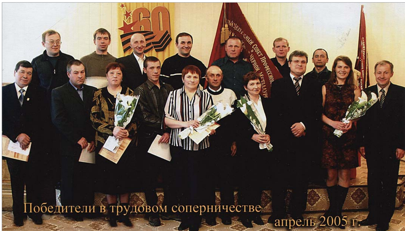
Победители в трудовом соперничестве

Давайте вспомним год 2005-й. К юбилейному Дню Победы динуровцы подошли с отличными производственными результатами, этому способствовала Трудовая Вахта. На этом снимке