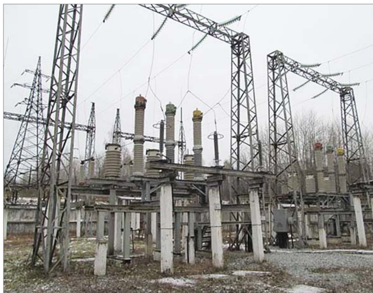
На главной понизительной подстанции завода.