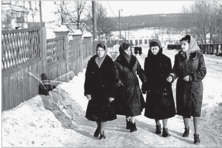
Этот снимок хранился в архиве заводского музея. Известно только приблизительное время, когда сделана фотография, - конец 50-х - начало 60-х годов. Активистки женсовета проходят мимо детского сада №15, что находился по соседству с музыкальной школой. Может быть, кто нибудь узнает этих активисток женсовета.

Такую работу вёл заводской женсовет в начале своей 75-летней истории.