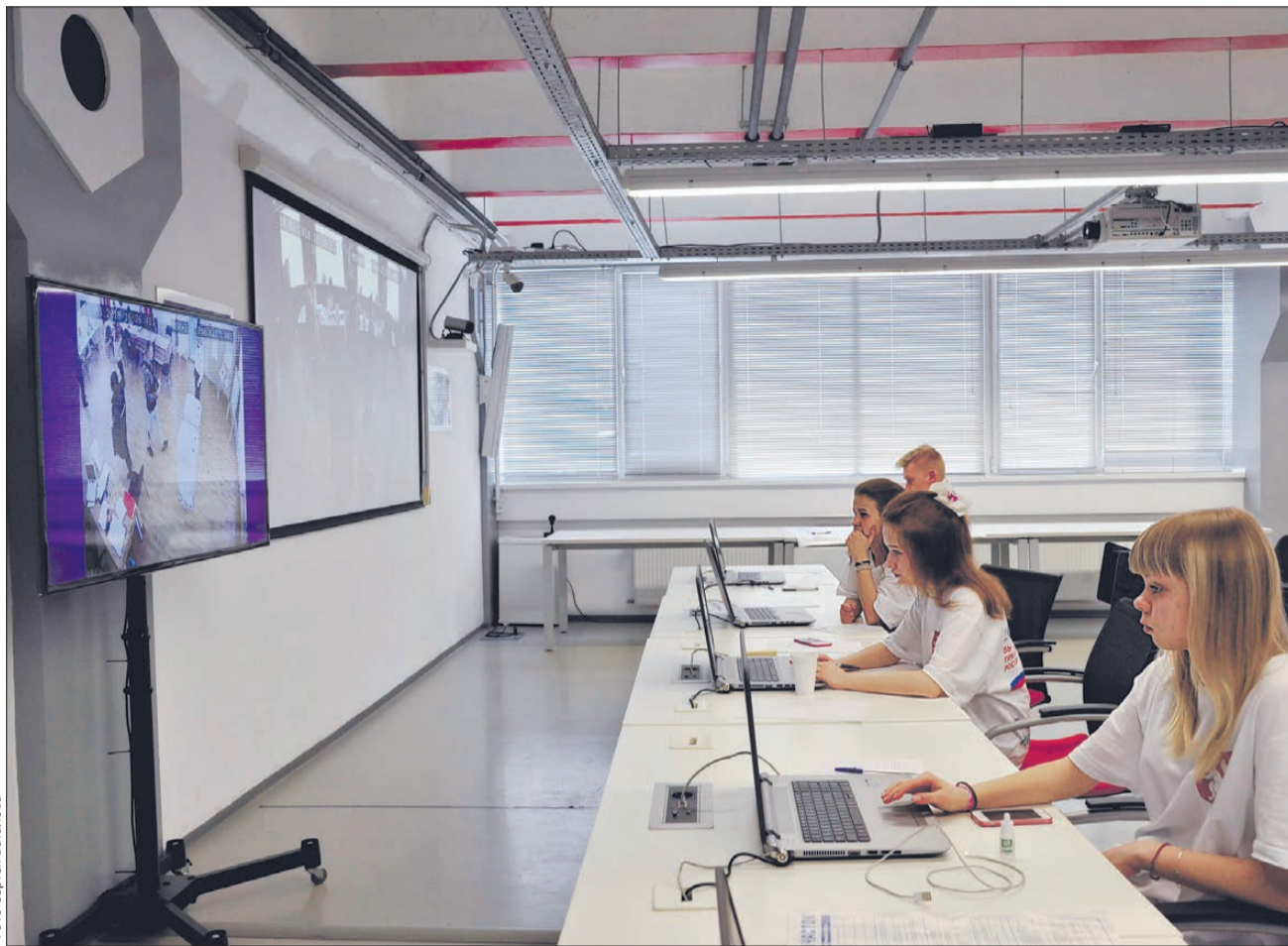
ЦОН служит отличной школой управления государством для волонтеров, которые здесь работали наблюдателями

В Единый день голосования вся страна могла наблюдать, как Первоуральск наблюдает за ходом выборов. Документальное «кино» в режиме онлайн показывал Центр общественного наблюдения.