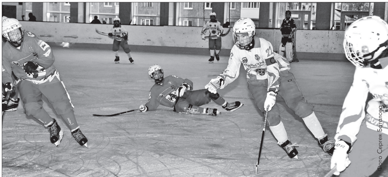
На льду сражаются «Уральский трубник-2001» и «Сибсельмаш»