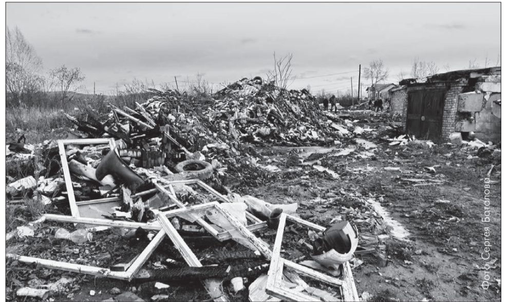
Сотрудники «Экофонда» дали руководству гаражного кооператива №10 время на уборку свалки – до начала ноября, иначе – штраф.