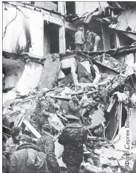
Разбор взорвавшегося подъезда. 1995 год

18 октября в деревне Вересовка состоялось общее собрание жителей дома, расположенного по адресу: Заводская, 14. О судьбе этого дома жители Первоуральска знают с 1995 года, именно тогда здесь, в первом подъезде, произошла трагедия – взрыв бытового газа, в результате которого погиб человек.