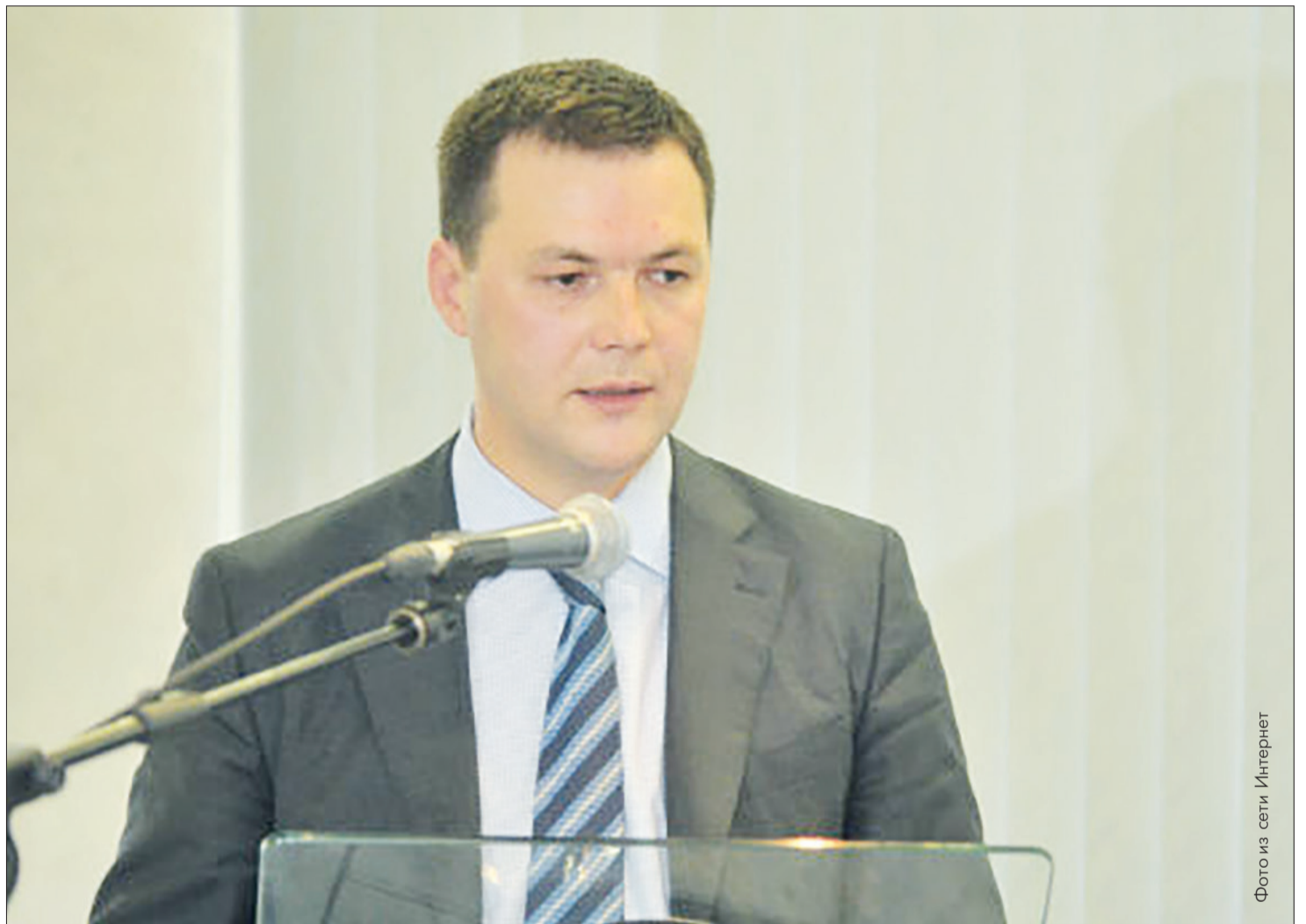
Алексей Дронов. Октябрь 2013 года. Выступление перед депутатами Первоуральской городской думы

- Я хочу, чтобы та система взаимодействия между различными властными структурами, предприятиями и организациями, которая сложилась в Первоуральске в течение последних лет, продолжила свое существование. И прежде всего я говорю о думе и администрации. Сегодня все прекрасно