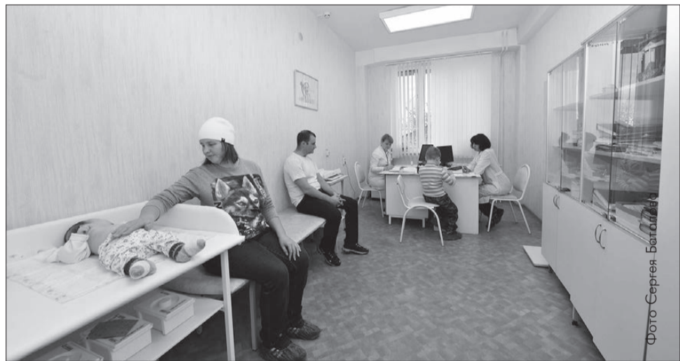
...зато на Гагарина, 38-а на прием можно запросто прийти даже всей семьей