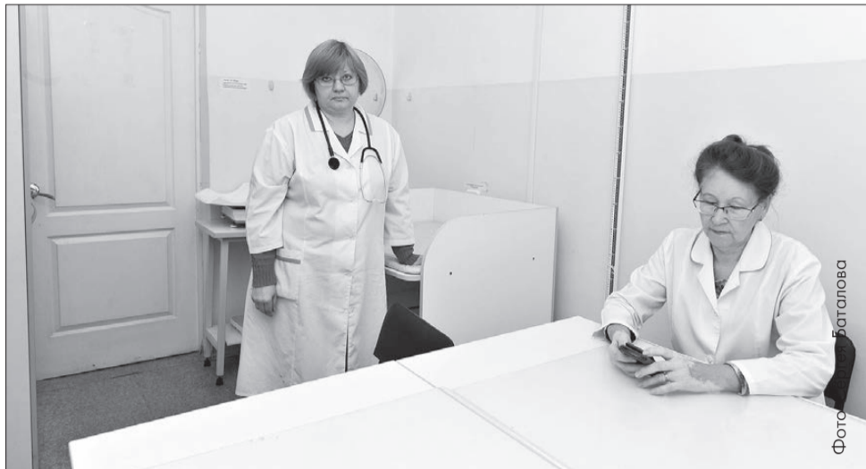
На Мамина-Сибиряка, 2-а пациентов не осталось: в кабинетах мало места...

1 октября маленьких пациентов микрорайона Хромпик педиатры начали принимать по новому адресу. Детская участковая служба, которая прежде располагалась в больничном городке на Мамина-Сибиряка, 2-а, переехала в детскую поликлинику на Гагарина, 38-а.