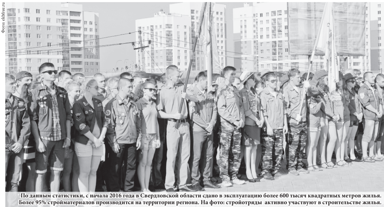
По данным статистики, с начала 2016 года в Свердловской области сдано в эксплуатацию более 600 тысяч квадратных метров жилья. Более 95% стройматериалов производится на территории региона. На фото: стройотряды активно участвуют в строительстве жилья.