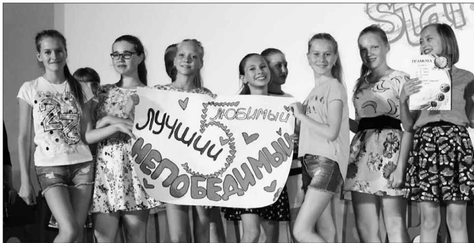
Мы выбираем лидеров!

Вопрос «как стать лидером» интересуют, вероятно, ребят всех возрастов, иначе мы бы не попали в «Гагарку» именно на