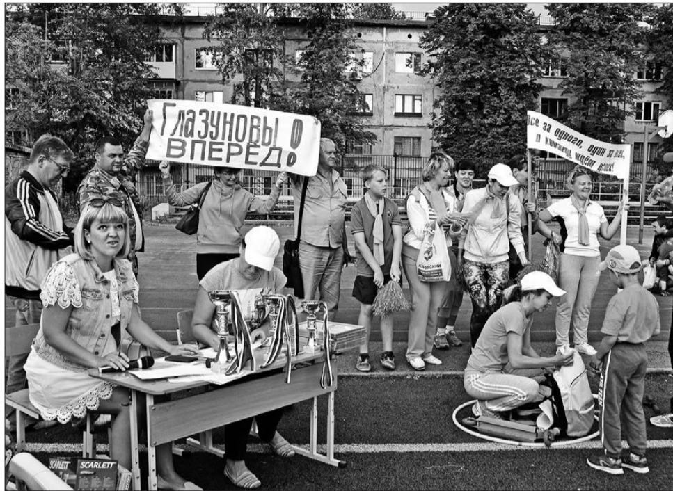
Конкурс "Веселые старты" прошел на стадионе школы №32

И один из приоритетов государственной молодежной политики – дать молодым людям возможность раскрыть свой потенциал, найти достойное место в жизни,