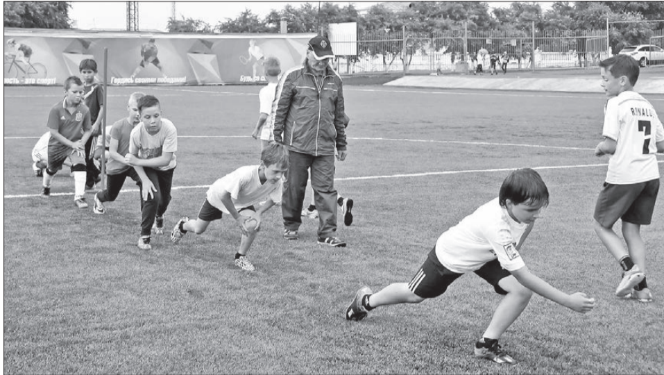
Хоккеисты летом переключаются на футбол. Тренировка на новом поле, которое соответствует стандартам FIFA

- Сотрудничество с клубами по месту жительства продолжается, соглашение о социальном партнерстве администрации, Новотрубного завода, ХК «Уральский