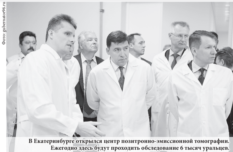
В Екатеринбурге открылся центр позитронно-эмиссионной томографии. Ежегодно здесь будут проходить обследование 6 тысяч уральцев.

Высокий профессионализм уральских медиков и усилия органов власти позволяют эффективно решать задачи сохранения здоровья свердловчан. Об этом 26 июля сказал губернатор Евгений Куйвашев на форуме медицинской общественности «Сила Урала: здоровье уральцев».