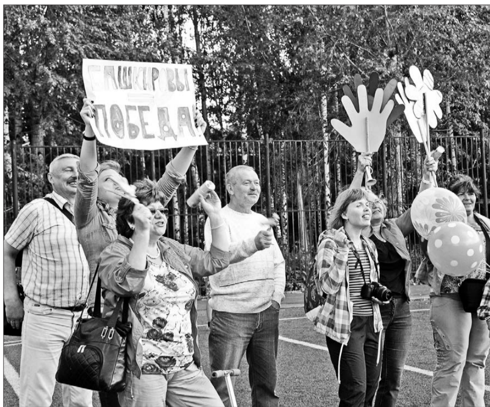
Отличные болельщики - залог успеха