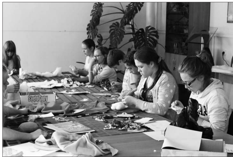
В мастерской добрых дел

Дети пятого отряда организовали мастерскую по изготовлению мягких игрушек, которые в родительский день предполагалось обменять на любые материальные пожертвования. Собранные деньги дети перечислят в один из благотворительных фондов, который занимается сбором средств болеющим детям.