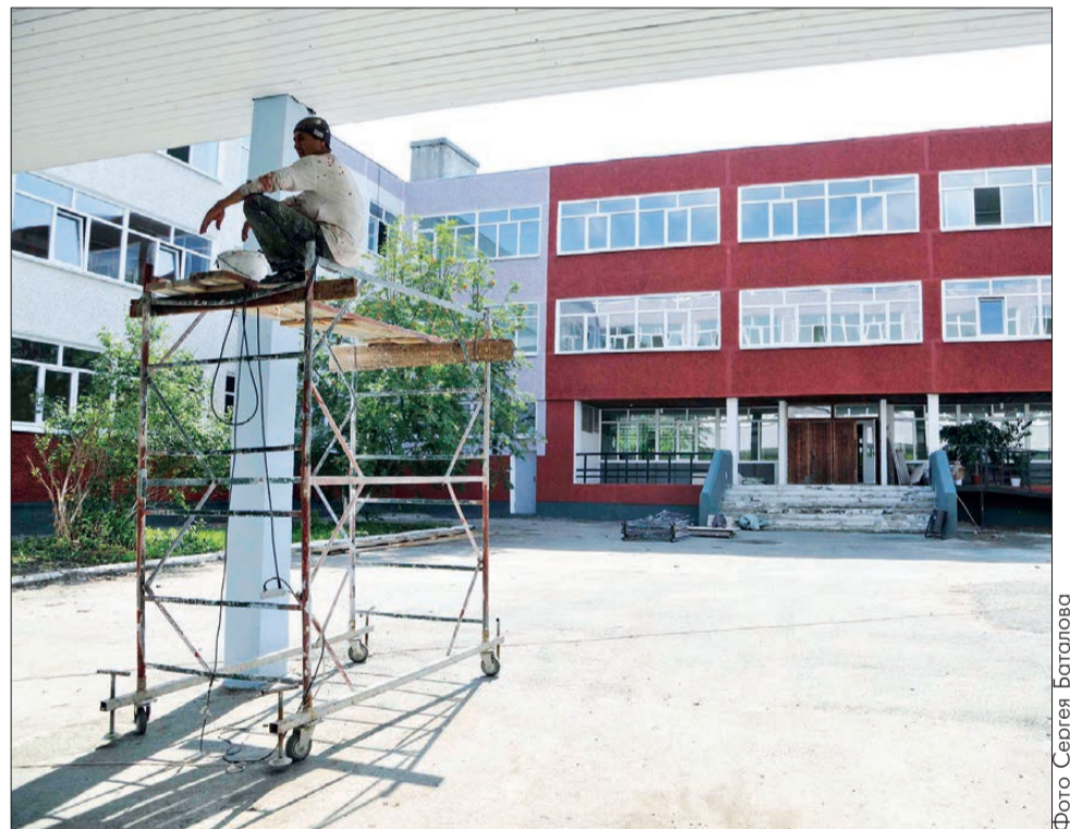
В школе № 7 строителям еще есть работа, но основной объем уже выполнен

- Все работы по подготовке общеобразовательных организаций к 1 сентября завершим в срок. Думаю, учебный год начнем без проблем. Хочу отметить, что мы продолжаем то, что было начато еще в 2015 году. Капремонт школы № 1 в прошлом году стал пробным проектом. После этого была подготовлена программа по проведению работ капитального характера и в других школах округа, рассчитанная до 2020 года. Так, в следующем, 2017-м, собираемся отремонтировать еще пять образовательных организаций.