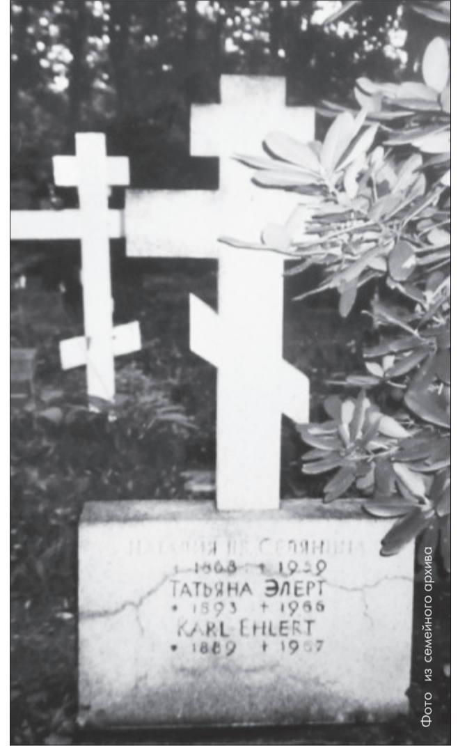
Могила Элертов на берлинском кладбище