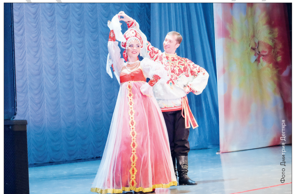
Ансамбль «Иван да Марья» дает в Первоуральске четыре концерта

- Дорогие коллеги, хочу поздравить вас с нашим общим профессиональным праздником. Все первоуральцы благодарны вам за ваш труд, за работу, которую вы всегда выполняли с максимальной ответственностью. Желаю вам здоровья и внимания со стороны ваших близких.