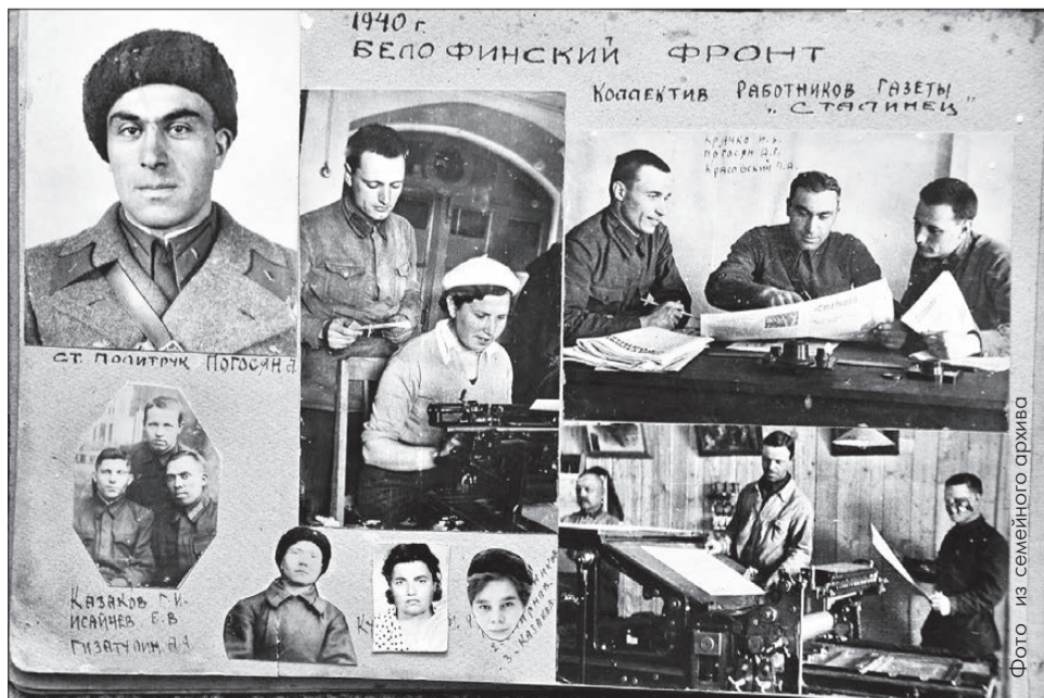
А это - страница из семейного альбома

А что известно о фронтовой печати? С врагом сражались армейские фронтовые, дивизионные и полковые газеты и еще самодельные «боевые листки», выпускавшиеся в подразделениях РККА. Немало известных поэтов и прозаиков прошли суровую закалку военной печати. Приведем один пример: «Василий Теркин» Александра Твардовского начал публиковаться именно на страницах «Красноармейской правды». Единствен-