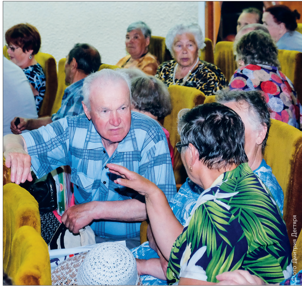
Праздник для ветеранов-новотрубников - это еще одна возможность встретиться с друзьями и коллегами

В Первоуральске начались мероприятия, посвященные, пожалуй, самому главному городскому празднику – Дню металлурга. В начале этой недели в большом зале ДК ПНТЗ ветераны-металлурги принимали поздравления от представителей завода, администрации городского округа и городской думы.