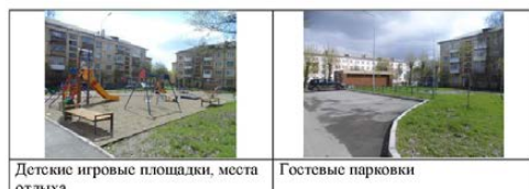
Детские игровые площадки, места отдыха Гостевые парковки

Объекты внешнего благоустройства, обустриваемые при реализации мероприятий по комплексному благоустройству дворовых территорий