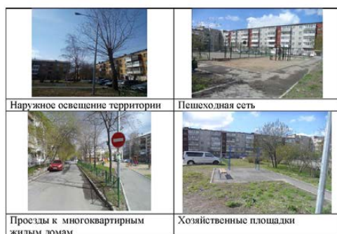
Наружное освещение территории