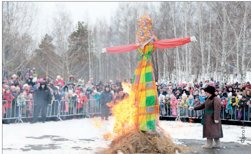
Блинов и зрелищ!