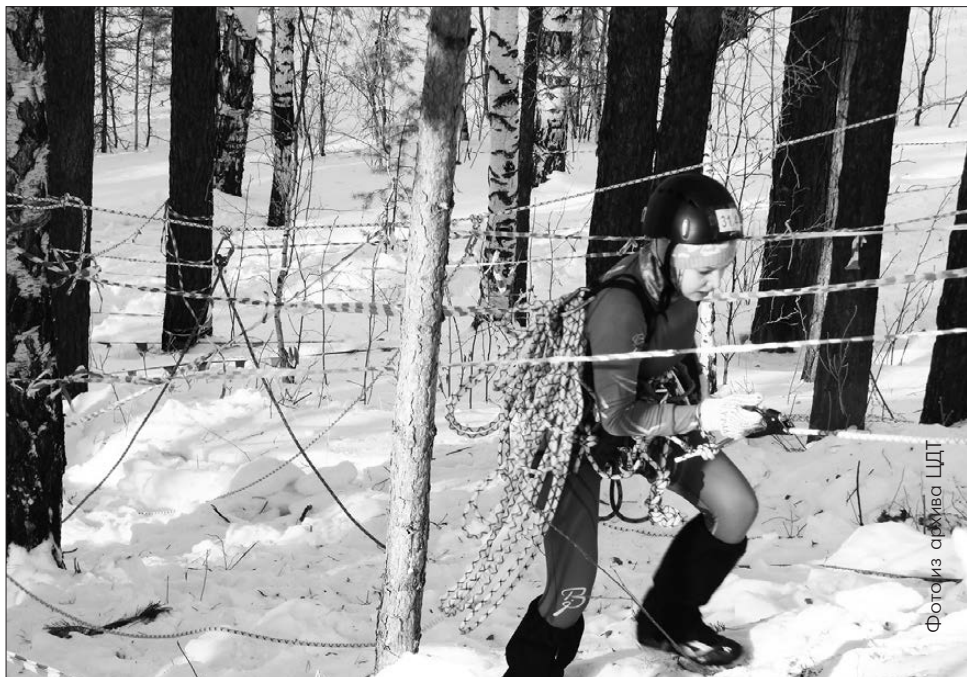
Переправа, переправа... Ошибок не прощает

Собрать палатку за считанные минуты, разжечь костер с одной спички и просто не растеряться в лесу – это вполне под силу «Горному лосю», команде ЦДТ, которая вошла в тройку лучших в области.