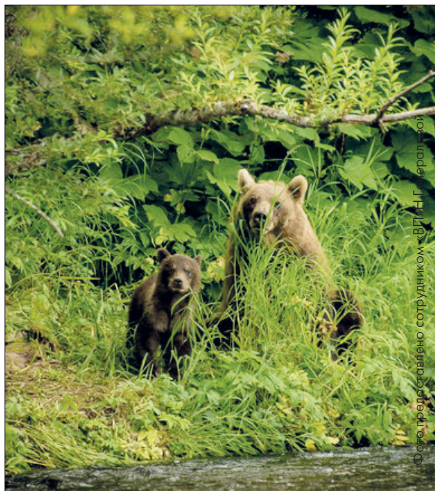
Медведи встретили туристов. Или туристы встретили медведей?

Спонсор нашего конкурса – магазин горящих туров «SunDali» подготовил для победителя ПРИЗ – ПРОЖИВАНИЕ В СОЧИ В СЕНТЯБРЕ 2016 Г. НА 4 ДНЯ (ТРИ НОЧИ).