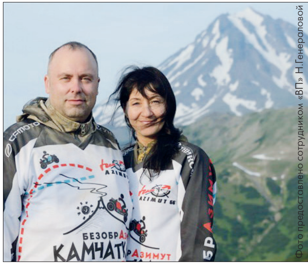
Камчатка - это мир небывалой красоты

Мы ждем ваши снимки до 14 июня 2016 года включительно!