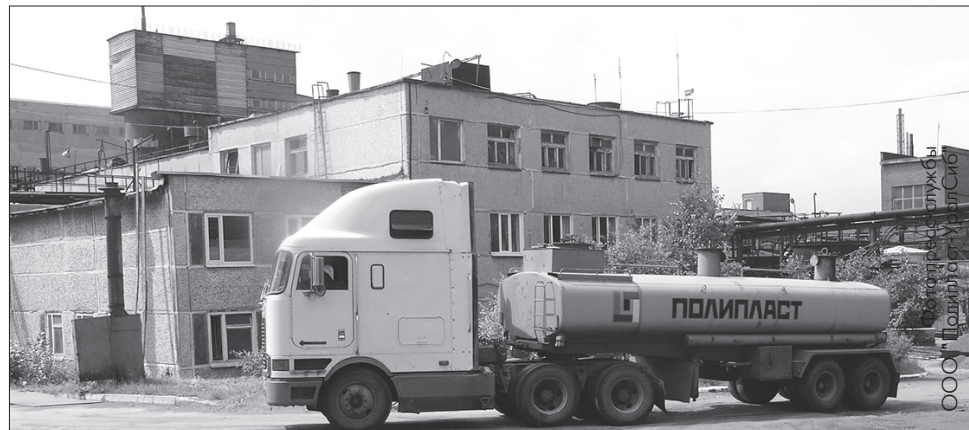
Над цехами предприятия больше нет труб. Единственная оставшаяся труба отвечает за отвод пара из сушильного отделения

Отмечу, что сброс загрязняющих веществ в сточные воды предприятием ООО «Полипласт-УралСиб» не осуществляется, поскольку у нас замкнутый оборотный цикл.