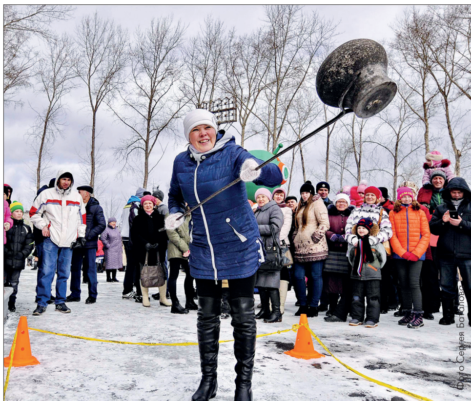
В горящую избу? Сначала чугунок поднят!

Зиму слушали внимательно, но площадку, в центре которой возвышалось ее чу-