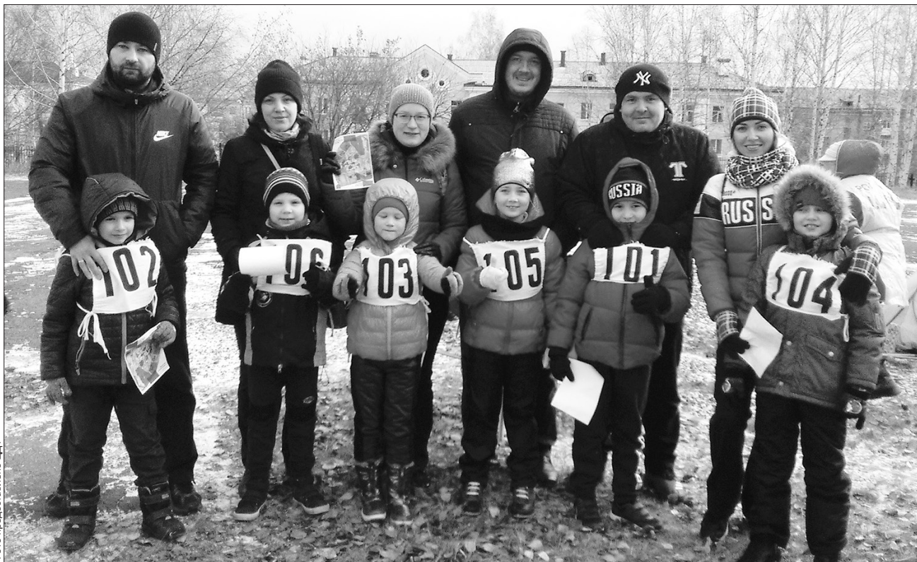
Дружная команда дебютантов спортивного ориентирования