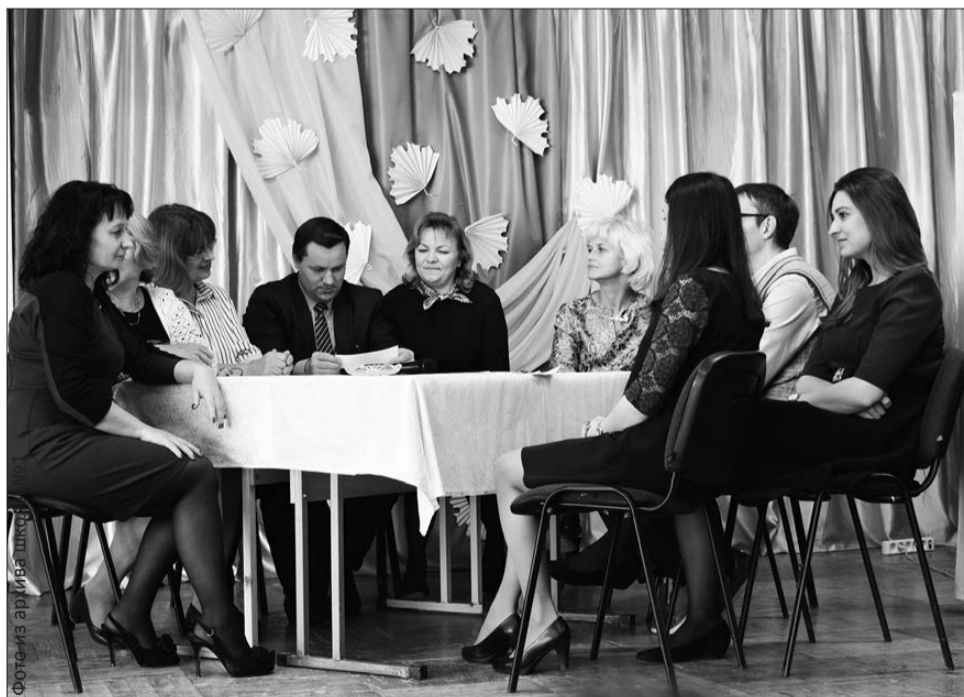
Знатоки: «Берем дополнительную минуту»

После уроков для виновников торжества началось все самое интересное. В актовом зале для них была подготовлена игра «Что? Где? Когда?». Заранее ученики составили увлекательные вопросы, а учителя собрали команду знатоков. Игра прошла «на ура». Учителя оценили наши вопросы, играли слаженно, в зале было весело, зрители активно обсуждали вопросы между собой. Зал разделился на две части: учителя, болеющие за своих коллег,