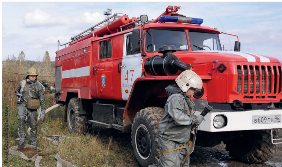
Пожарный расчет только что прибыл на очистные сооружения. Перед тем, как зайти в зону поражения, наденут противогазы

На прошлой неделе, с 4 по 6 октября, проходила ежегодная Всероссийская тренировка по гражданской обороне. Ее задачей было смоделировать чрезвычайные ситуации, которые вполне возможны и которых хотелось бы избежать. Чтобы каждый, случись беда, четко представлял порядок действий. Паника и растерянность — самые худшие советчики при ЧС.