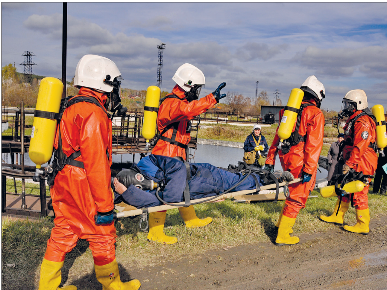
За работой спасатели. Пострадавший эвакуирован