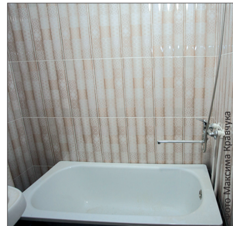
Стены ванной выложены кафелем

– Владельцы квартир в новом доме имеют право на перепланировку квартир и на приватизацию в соответствии с Жилищным кодексом РФ. При перепланировке администрация поможет согласовать все необходимые документы и издать соответствующий нормативный правовой акт в кратчайшие сроки. А процесс приватизации обычный, как во всех других домах.