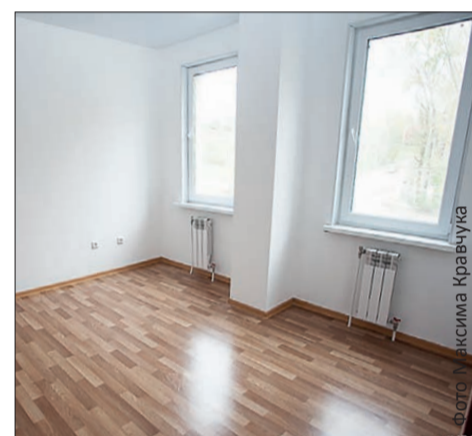
Комнаты светлые и уютные

волнующиеся новоселы рассказывают, что в доме имеются и недоработки: например, неплотно прилегающий плинтус, незакрепленная розетка, «пузлы» на линолеуме. Но все они устранимы.