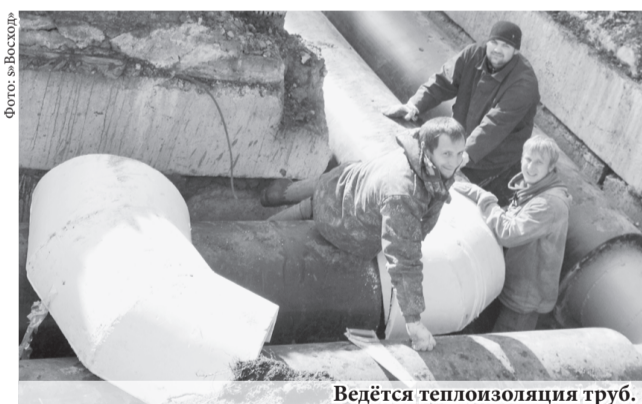
Ведётся теплоизоляция труб.

На главный вопрос «о парилке» специалист ответил, что свою работу они выполняют качественно и отвечают за неё стопроцентно. Проблема горожан решается, а это значит, что власти действуют в правильном направлении теплосбережения.