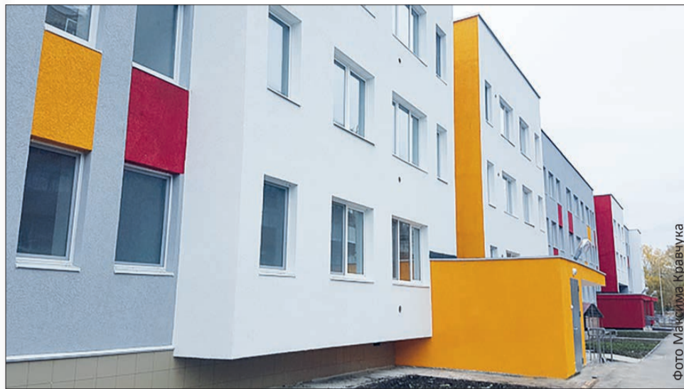
Новый дом на Кирова, 3, третий корпус

Завершилось заселение нового двухсекционного дома №3 на улице Кирова микрорайона Динас, специально возведенного для переселенцев из ветхого аварийного жилья. На этой неделе еще 33 жителя с улиц Цветочная и Сакко и Ванцетти получили ключи от новых квартир в корпусе №3.