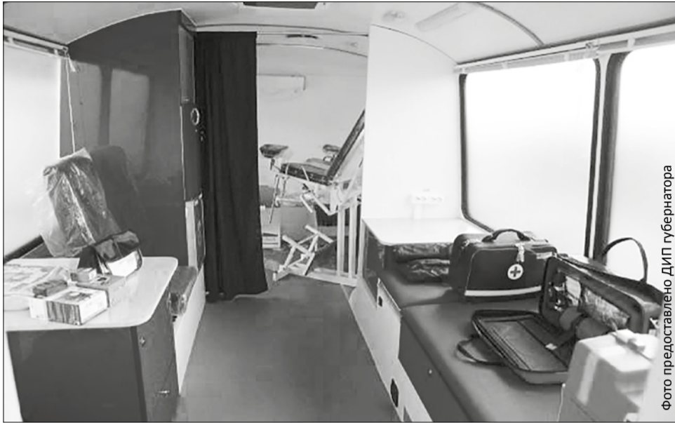
Вот так выглядит изнутри современная карета скорой медицинской помощи

Автопарк станции скорой медицинской помощи пополнился двумя новенькими «ГАЗелями». Эти машины будут спешить на вызов к маленьким пациентам городского округа Первоуральск.