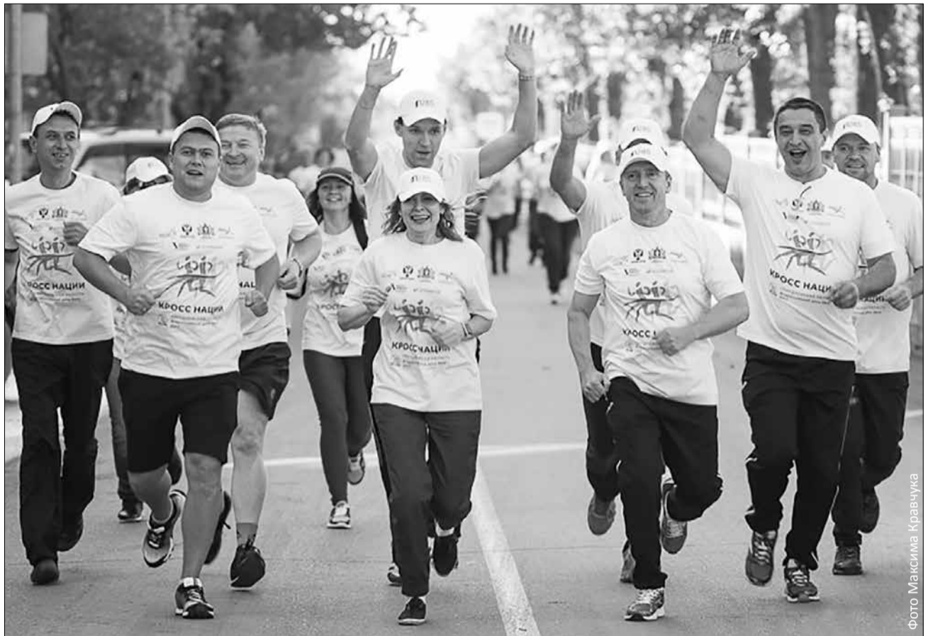
Команда администрации открыла «Кросс нации». Бежим за здоровый образ жизни!

В субботу, 16 сентября, по центру города промчался «Кросс нации» – Всероссийская акция, в которой, как всегда, активно принял участие и наш городской округ. В этом году мероприятие посвящалось 285-летию Первоуральска.