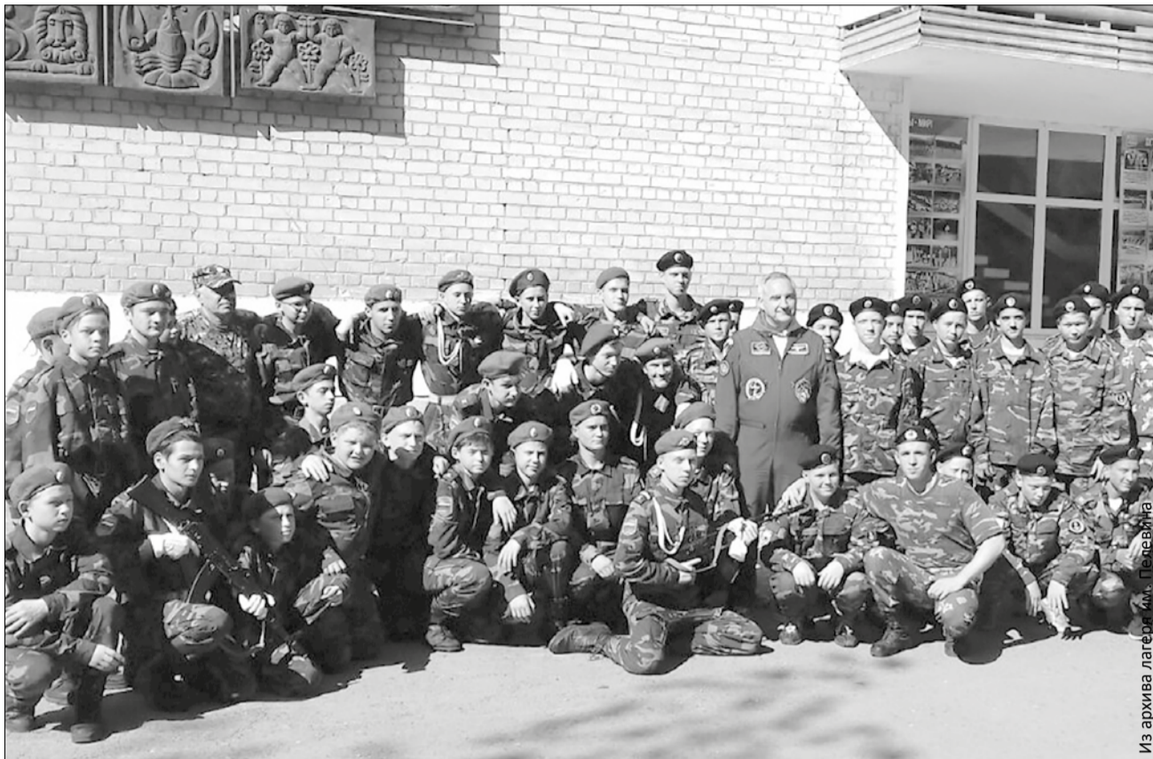
Из архива лагеря им. Пелевина

В субботу, 19 августа, в загородном лагере «Исетские зори» открылась смена оборонно-спортивного лагеря имени капитана Федора Пелевина.