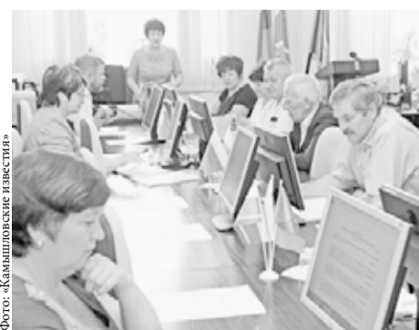
в Ожгихе и Раздольном, создание жилфонда для предоставления жилья медработникам, строительство газопровода и другое.

Депутаты камышловской районной думы подвели итоги пятилетней работы и наметили план работ для думы следующего созыва, пишут «Камышловские известия». Так, заместитель главы района Светлана Глубоковская представила программу «Пятилетка развития Камышловского муниципального района (2017-2021 годы)». Среди приоритетных станут такие направления, как организация обучения школьников в одну смену, создание условий для сдачи норм ГТО, ремонт действующих и строительство новых ФАПов