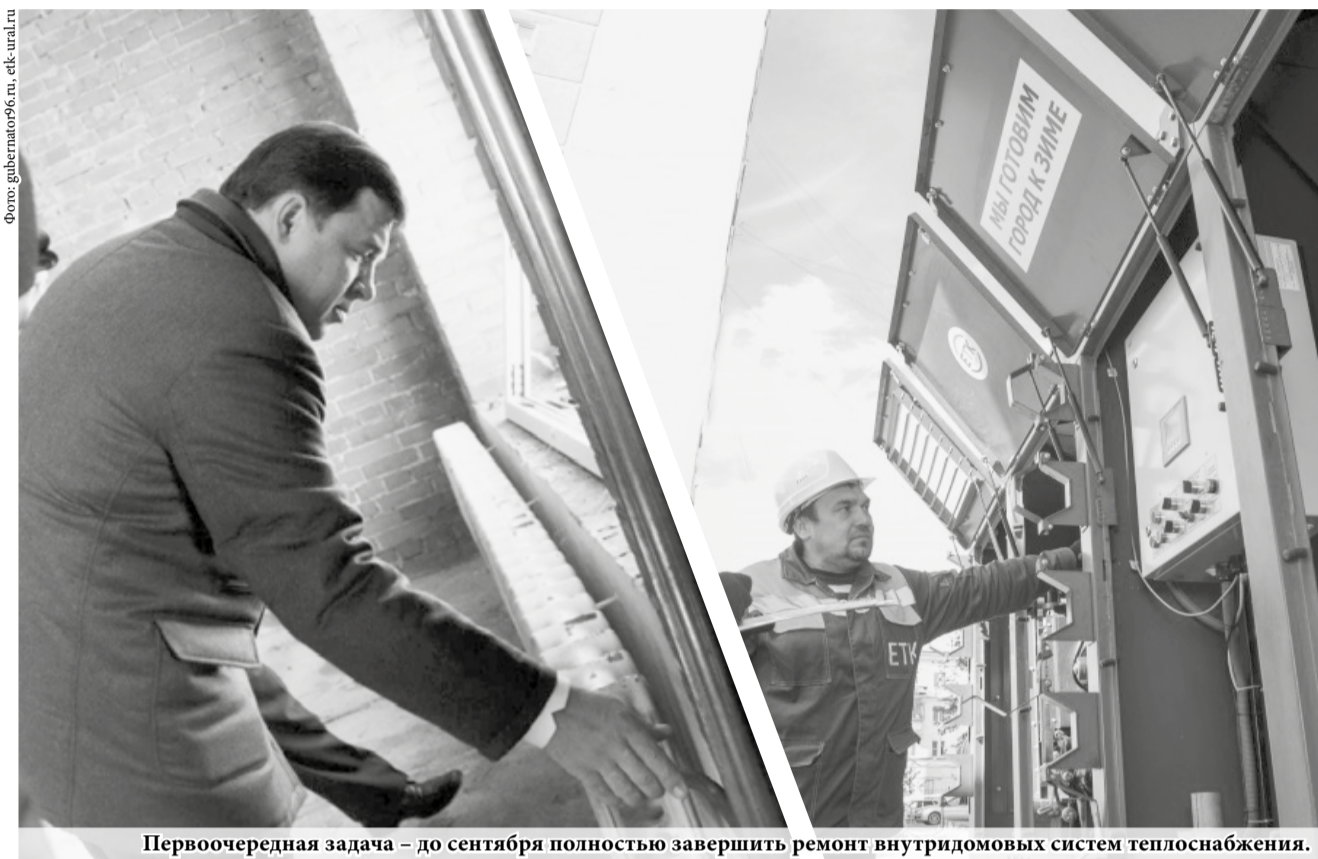
Первоочередная задача – до сентября полностью завершить ремонт внутридомовых систем теплоснабжения.

«За счёт этих денег будет проведено восстановление тех систем, от технического состояния которых напрямую зависит и комфортность проживания граждан, и экономическое состояние коммунальных предприятий», – подчеркнул министр энергетики и ЖКХ региона Николай Смирнов.