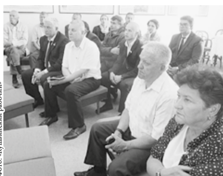
ки территории, предназначенной для индивидуального жилищного строительства в посёлках Верхняя Баранча и Восток.

Кроме того, выделены средства на разработку проекта планиров-