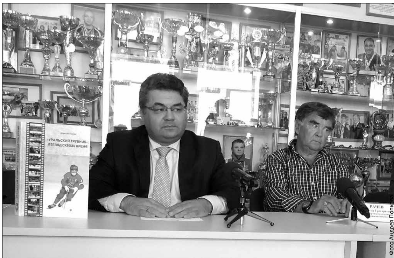
Книга «Уральский трубник: взгляд сквозь время» поступит во все библиотеки города, а также библиотеки школ и предприятий. В дальнейшем будет создана электронная версия книги

Руководители ХК «Уральский трубник» презентовали книгу-энциклопедию «Уральский трубник: взгляд сквозь время», а также пригласили первоуральцев на торжественный вечер, посвященный 80-летию команды, который пройдет в субботу, 26 августа, в Ледовом дворце.