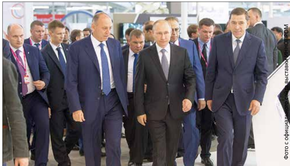
Владимир Путин провел на ИННОПРОМЕ два дня