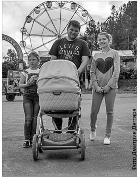
Гости «Ромашкового настроения»