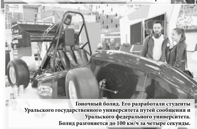
Гоночный болид. Его разработали студенты Уральского государственного университета путей сообщения и Уральского федерального университета. Болид разгоняется до 100 км/ч за четыре секунды.