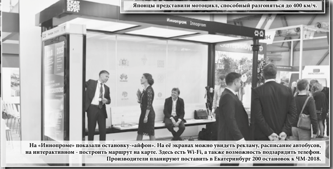
На «Иннопроме» показали остановку-«айфон». На её экранах можно увидеть рекламу, расписание автобусов, на интерактивном – построить маршрут на карте. Здесь есть Wi-Fi, а также возможность подзарядить телефон. Производители планируют поставить в Екатеринбург 200 остановок к ЧМ-2018.