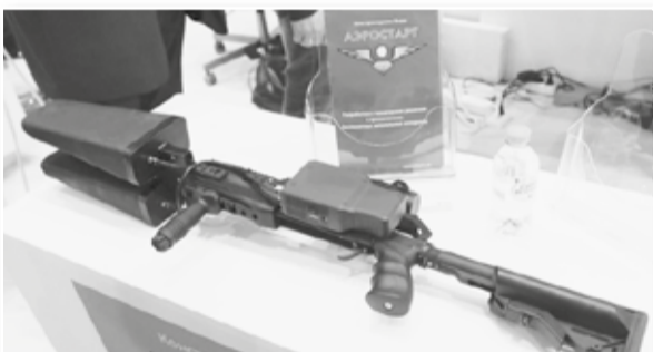
КБ «Аэростарт» представил прототип ружья для принудительной посадки беспилотных летательных аппаратов. Радиус действия системы «Заслон» составляет до полукилометра.