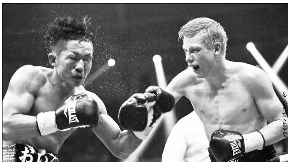
Бой и в самом деле получился жестким