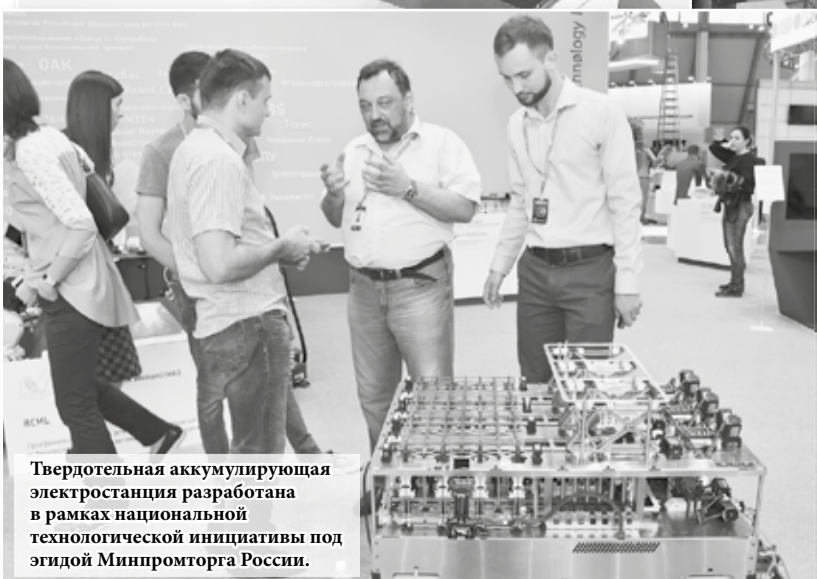
Твердотельная аккумулирующая электростанция разработана в рамках национальной технологической инициативы под эгидой Минпромторга России.