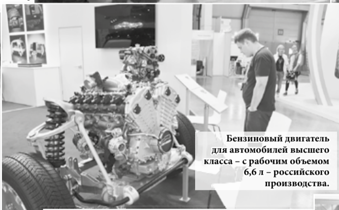
Бензиновый двигатель для автомобилей высшего класса – с рабочим объемом 6,6 л – российского производства.