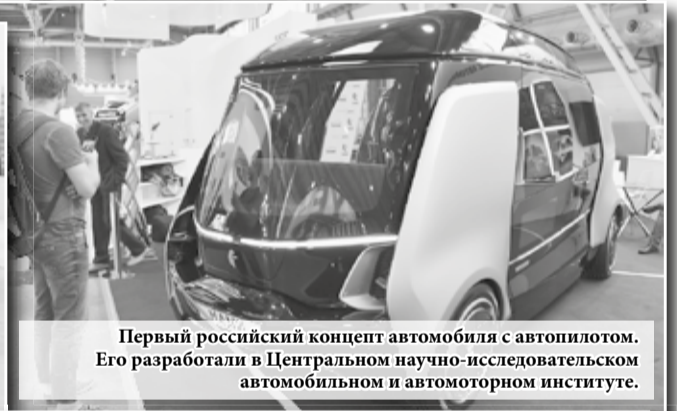
Первый российский концепт автомобиля с автопилотом. Его разработали в Центральном научно-исследовательском автомобильном и автомоторном институте.