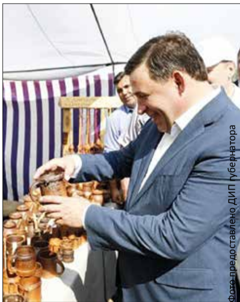
Евгений Куйвашев на Ирбитской ярмарке в 2016 году

При этом параллельно формируется и план туристических мероприятий на будущее: ежегодный календарь дополняется постоянно. Подать заявку на включение в него своего события может любой муниципалитет. Попасть в календарь-справочник могут как уже зарекомендовавшие себя мероприятия, так и новые, ранее не реализованные проекты. Культурные, спортивные, музыкальные, гастрономические, развлекательные — любые событийные мероприятия, формирующие культуру отдыха и способствующие развитию