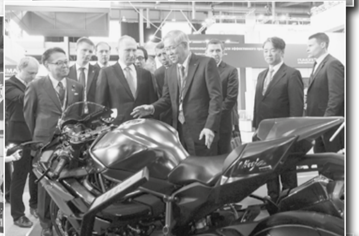
Японцы представили мотоцикл, способный разогнаться до 400 км/ч.