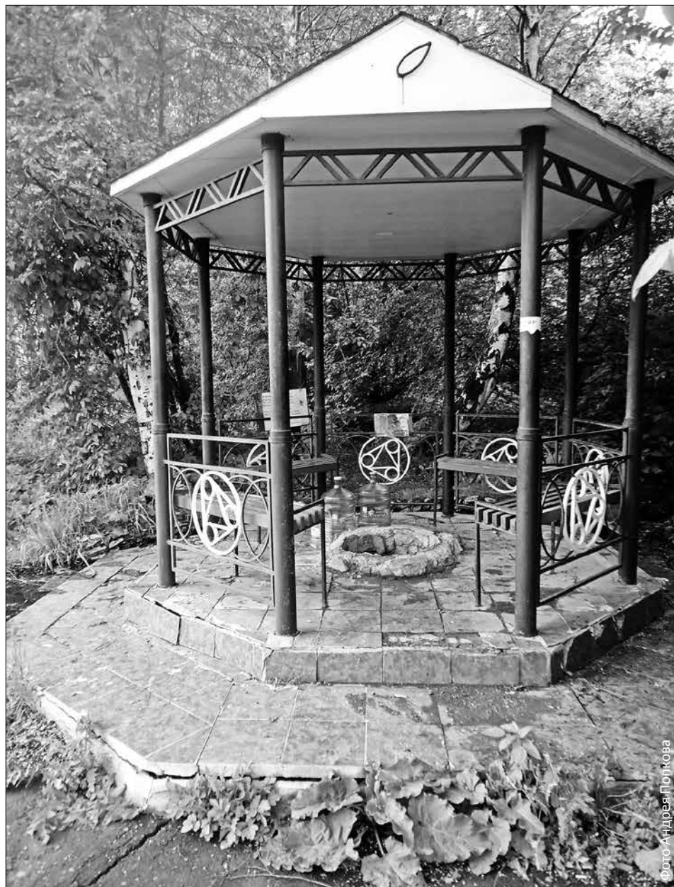
Родник «Даниловский» у старого обелиска «Европа-Азия» наиболее благоустроен

— У воды из источников есть как свои плюсы, так и минусы, — говорит Алек-