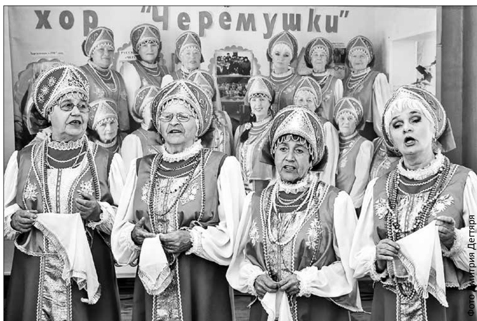
Для хора русской песни «Черемушки» сцена везде, где есть слушатели

Женщины из ансамбля русской песни «Черемушки» настаивают, чтобы их называли исключительно «молодушки», никаких бабушек. И они правы, ведь коллектив в самом расцвете сил – ему исполняется 30 лет.