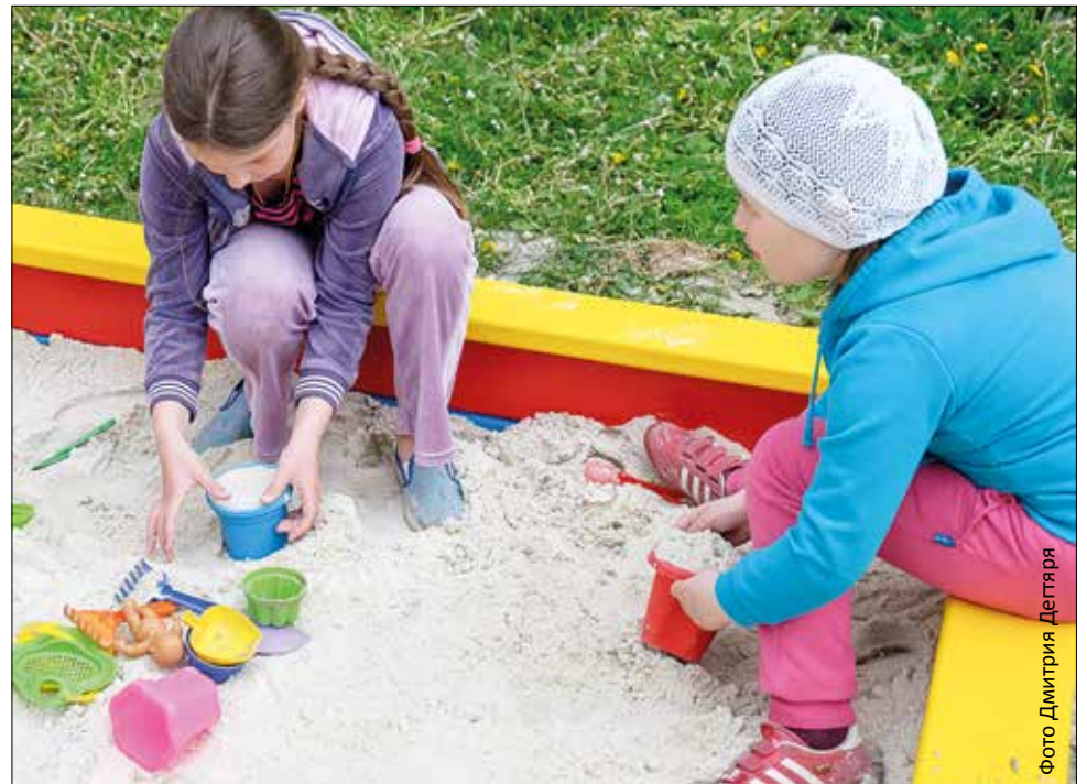
И в век компьютеров дети любят играть в песочнице