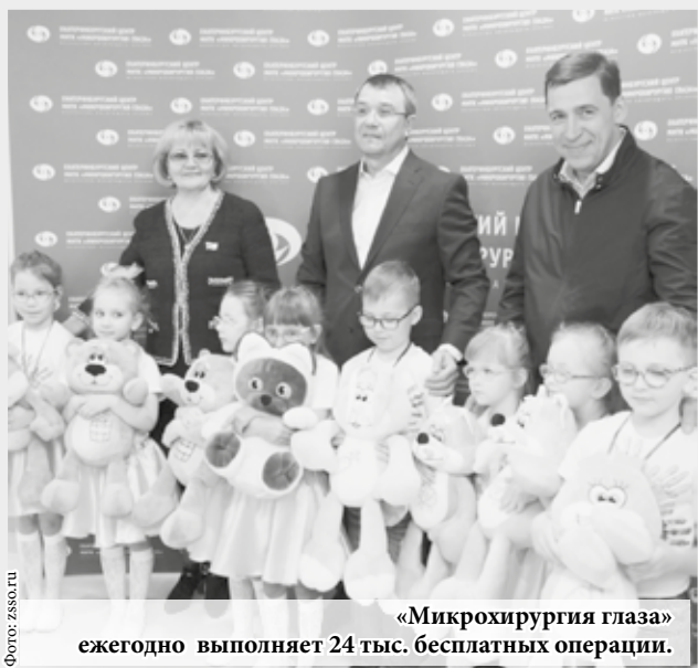
«Микрохирургия глаза» ежегодно выполняет 24 тыс. бесплатных операций.