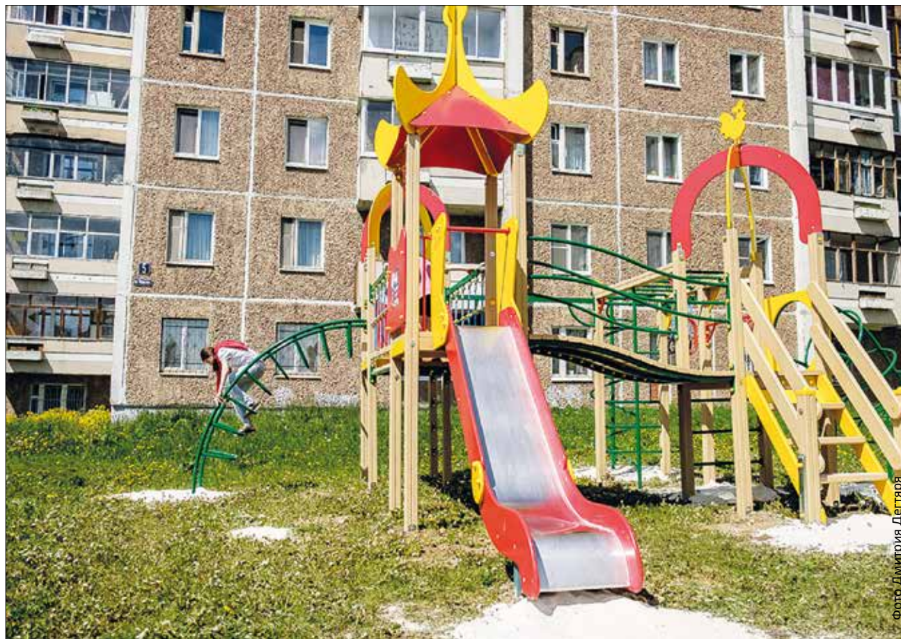
Детская площадка больше напоминает игровой городок. Эта украсила улицу Чекистов, напротив дома №9

слову, один городок недавно украсил территорию детской поликлиники.