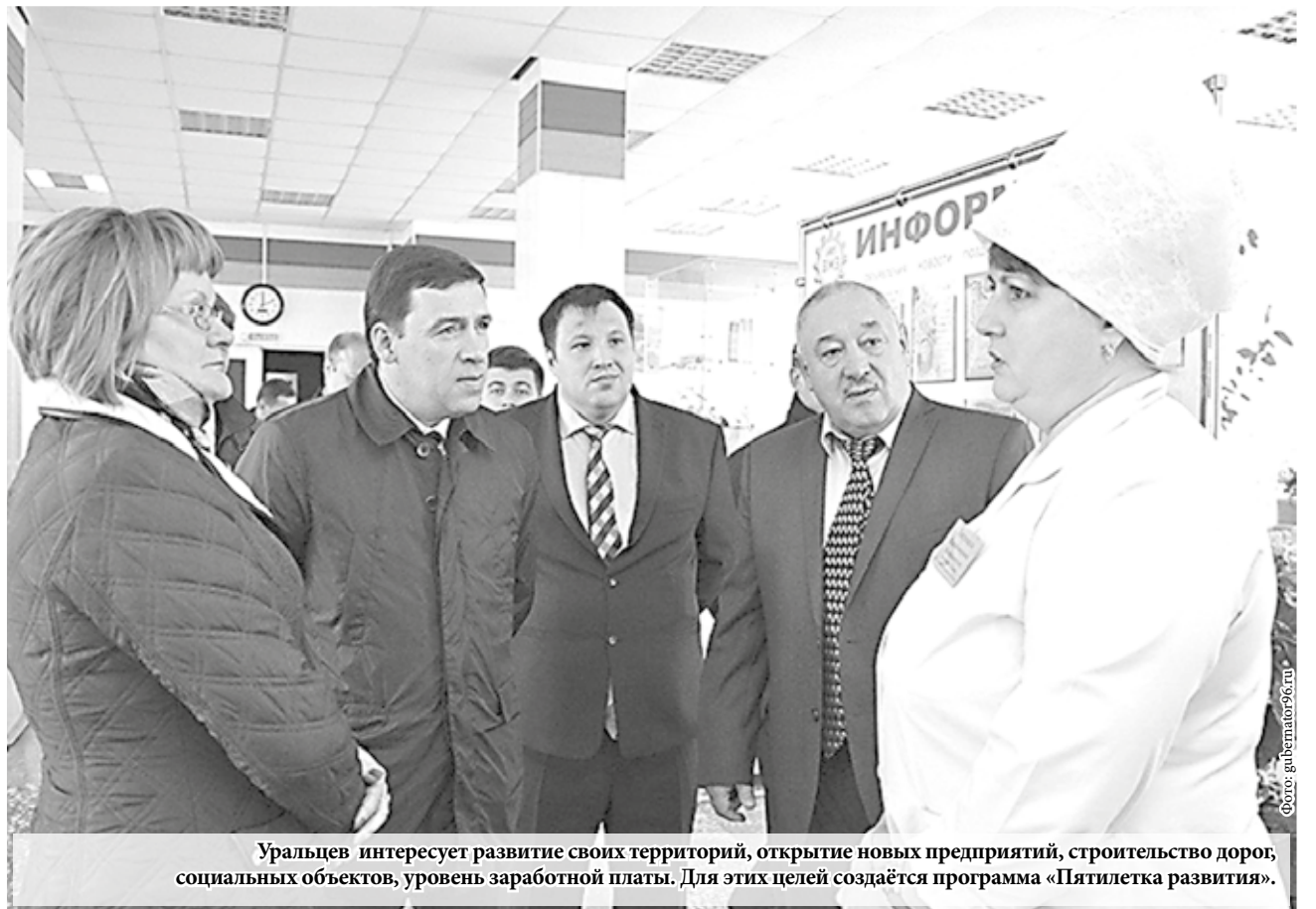
Уральцев интересует развитие своих территорий, открытие новых предприятий, строительство дорог, социальных объектов, уровень заработной платы. Для этих целей создаётся программа «Пятилетка развития».

«От вас зависит, какие стратегические документы будут приниматься на муниципальном уровне – их качество, проработка, учёт мнения местного сообщества. Чтобы у вас не возникало иллюзий: сложно будет говорить о выделении муниципалитетам средств из областного бюджета без чёткого понимания того, для решения каких конкретных стратегических задач эти средства направляются. Поэтому наличие стратегии муниципального образования становится определяющим. Стратегические приоритеты должны быть согласованы городским сообществом и скоординированы с программой развития Свердловской области», – заявил Евгений Куйвашев.