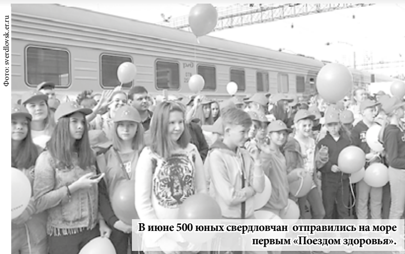
В июне 500 юных свердловчан отправились на море первым «Поездом здоровья».

Средний Урал входит в число регионов-лидеров России по объемам финансирования оздоровительной кампании. Глава региона Евгений Куйвашев поручил обеспечить высокий уровень организации летнего отдыха детей, на который в этом году выделено 1,8 миллиарда рублей.