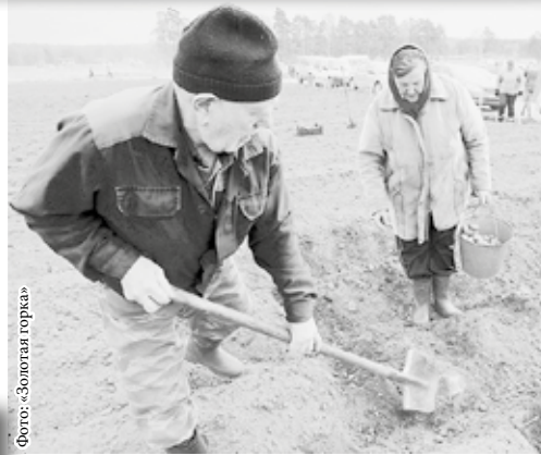
Фото: «Золотая горка»