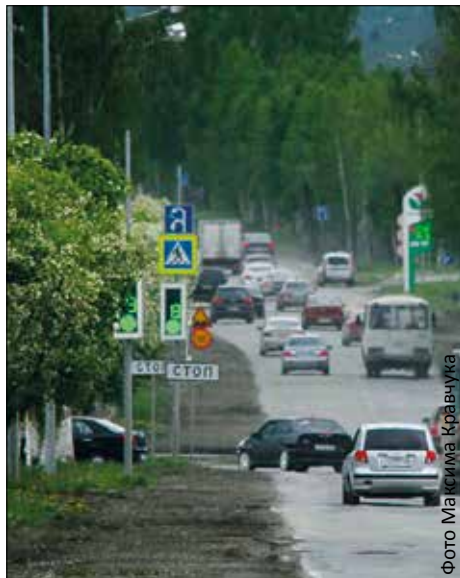
Дорожную одежду Московского тракта заменят на обеих полосах

Если позволит погода, продолжила Марина Шолохова, то подрядчик — это фирма из Екатеринбурга — должен выполнить свои обязательства к 1 сентября. К ремонту дорожники