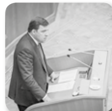
1-я программная статья «Сохраним опорный край Державы»