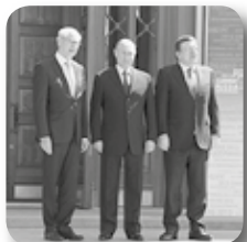
Евгений Куйвашев в составе делегации на Саммите РФ-ЕС в Екатеринбурге