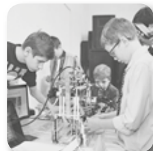
Создание «Уральской инженерной школы»