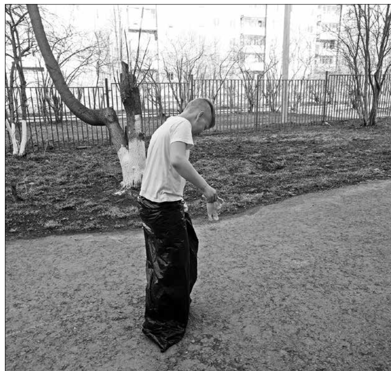
Работали весело. Кое-кто даже сумел принять участие в «забеге в мешках». Мальчишки всегда остаются мальчишками...