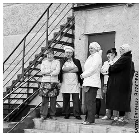
Сотрудники столовой, которые тоже эвакуировались