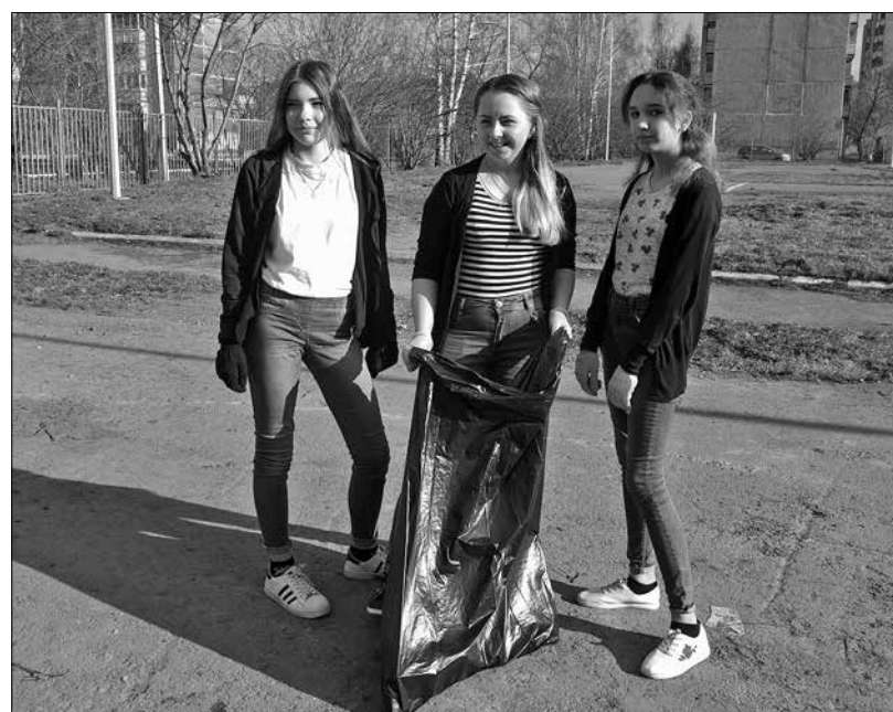
На вопрос, нравится ли им убирать территорию школы, все ответили, что, конечно, это стоит определенных усилий, но зато после проделанной работы очень приятно смотреть на свежую, зеленую траву и понимать, что ты привнес свой вклад в чистоту окружающего мира.