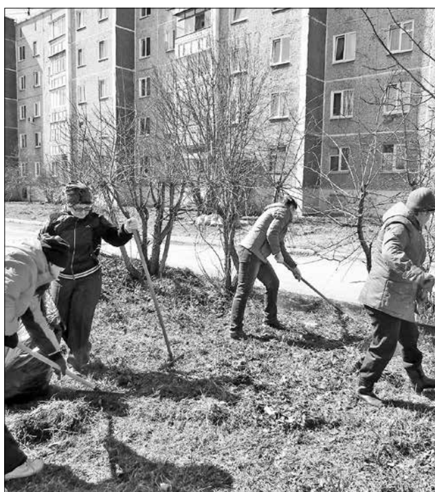
А старшеклассники и учителя боролись с прошлогодней листвой и травой...