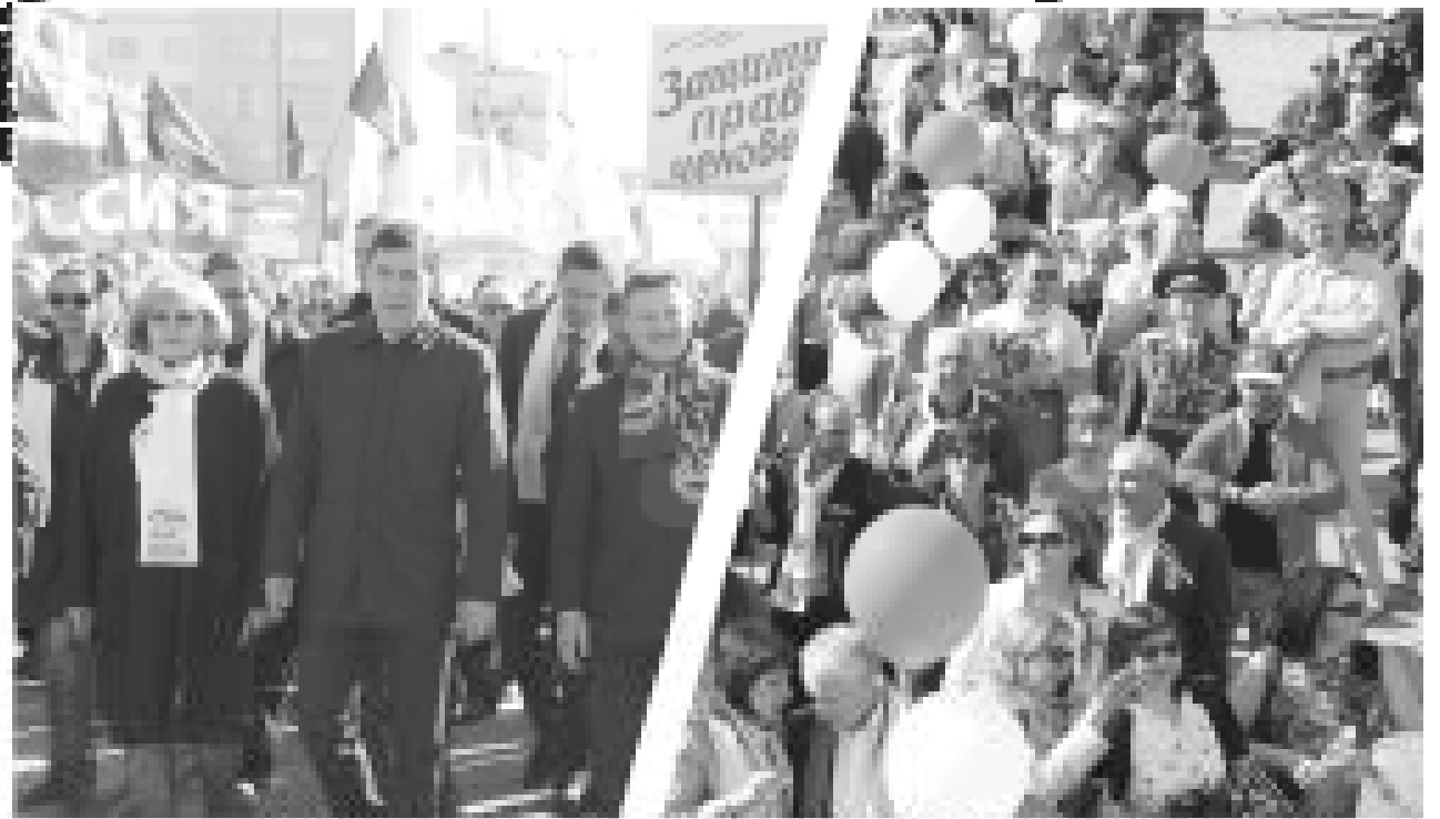
Уралам и Свердловской области посвящается. Праздник посвящен трудовым традициям и труду. В этот день мы вспоминаем тех, кто построил наш город и сделали его таким, какой мы его знаем сегодня.

Каждый из нас имеет свой трудовой стаж. Это время, которое мы проводим на работе, отдавая свои силы и знания. Этот стаж является основой нашего благополучия и благополучия нашего общества.