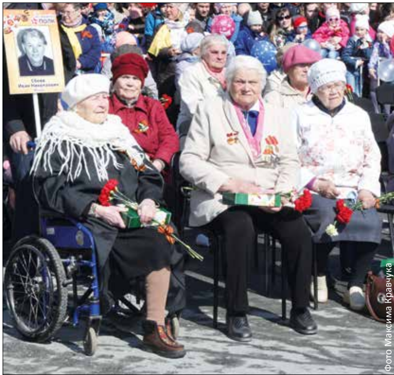
Площадь Победы. В первых рядах — почетные гости праздника

День Победы по-первоуральски завершился самыми мирными залпами — всполохами праздничного салюта. Поколение победителей помнит, как доблестно в годы войны с врагом сражался и тыловой город.