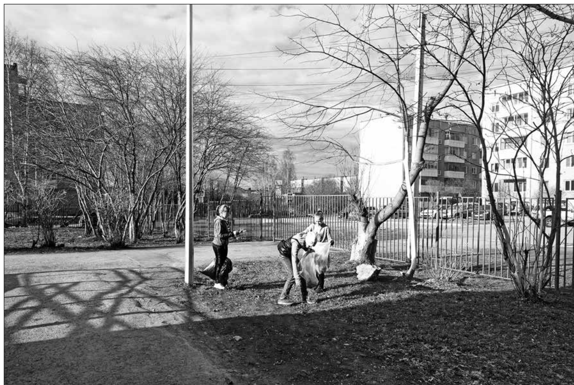
Ученикам младших классов доверили самую кропотливую работу – очистить территорию школы от мелкого мусора.

После того, как на улицах Первоуральска растаял последний снег, первоуральцы, вооружившись метлами, лопатами и носилками, вышли на традиционные весенние субботники. Моя самая любимая, родная и замечательная девятая школа тоже не осталась в стороне от генеральной уборки, ее ученики воспользовались шансом сделать город красивее и опрятнее. О том, как проходила работа, узнаете из нашего фоторепортажа.