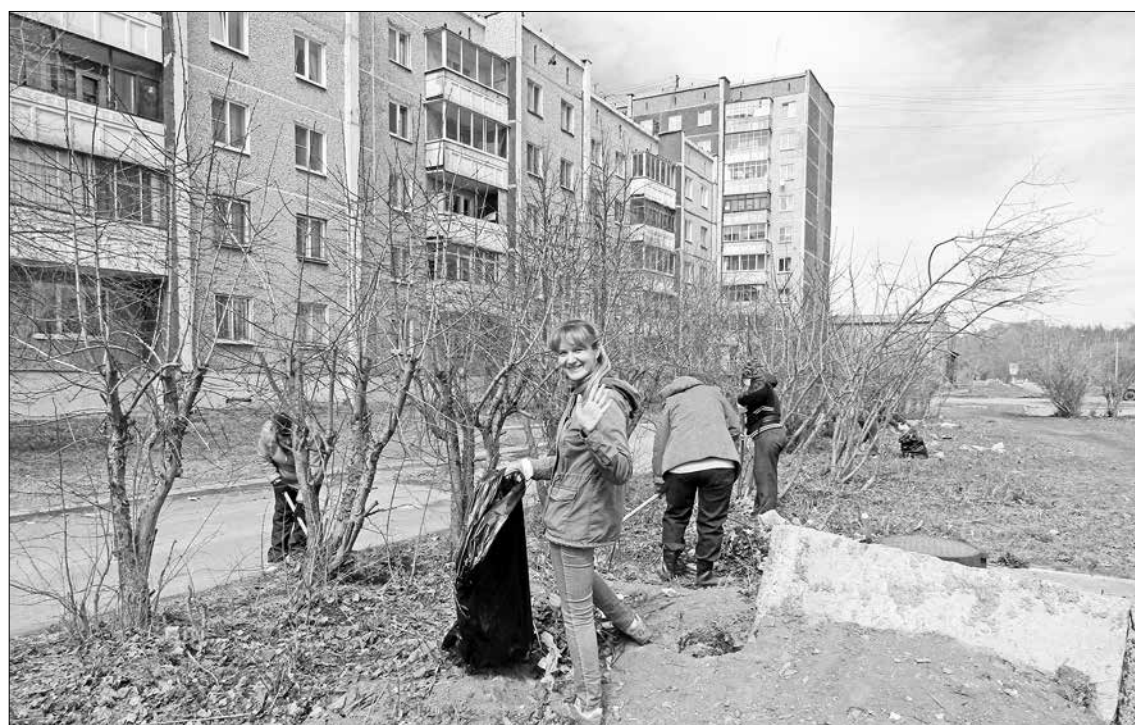
... и тут тоже нашлось время для улыбок.