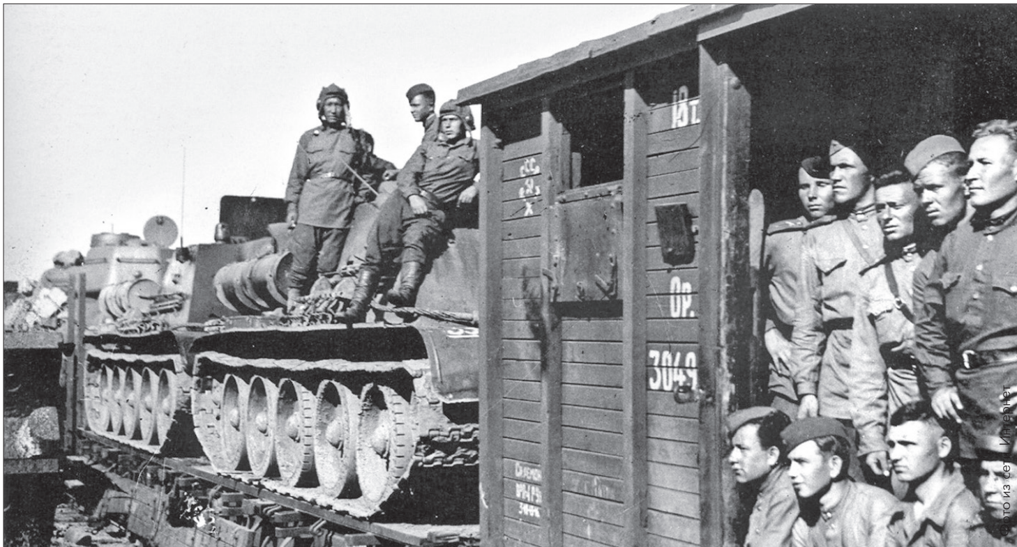
Бойцы Уральского добровольческого танкового корпуса едут на фронт