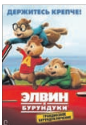
ЭЛВИН И БУРУНДУКИ: ГРАНДИОЗНОЕ БУРУНДУКЛЮЧЕНИЕ Мультфильм (6+)