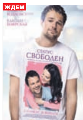
СТАТУС: СВОБОДЕН Комедия (16+)