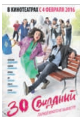
30 СВИДАНИЙ Комедия (16+)