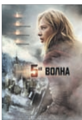
5-Я ВОЛНА Фантастика (12+)