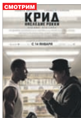
КРИД: НАСЛЕДИЕ РОККИ Драма (16+)

«Восход» (т. 66-74-45) «Сфера Синема» (т. 29-79-50)