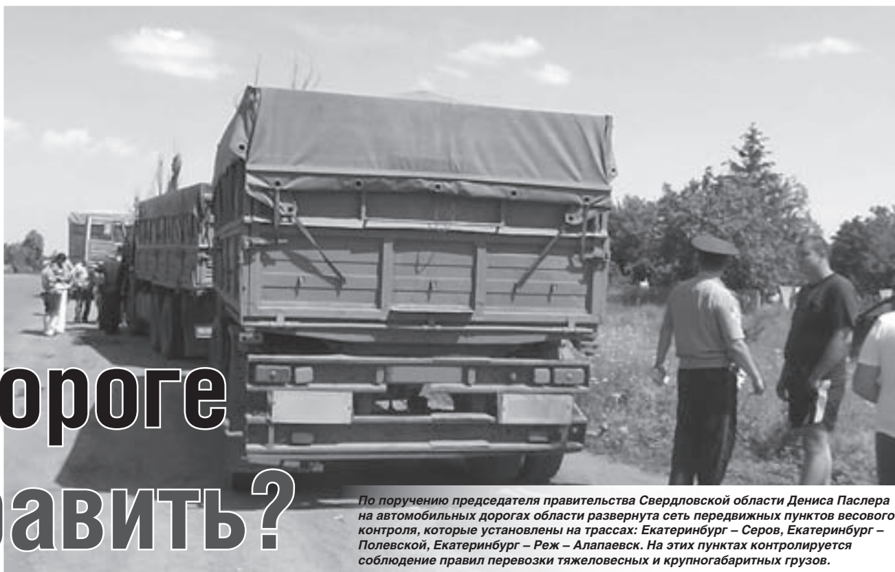
По поручению председателя правительства Свердловской области Дениса Паслера на автомобильных дорогах области развернута сеть передвижных пунктов весового контроля, которые установлены на трассах: Екатеринбург – Серов, Екатеринбург – Полевской, Екатеринбург – Реж – Алапаевск. На этих пунктах контролируется соблюдение правил перевозки тяжеловесных и крупногабаритных грузов.

Перевозить грузы промышленных предприятий предлагается не на автомобильном, а на железнодорожном транспорте. Такое предложение в этом году озвучило региональное министерство транспорта и связи. Это обосновано влиянием тяжёлых машин на дорожное полотно. Весной и летом на автомобильных дорогах Свердловской области традиционно на месяц устанавливают временное ограничение движения тяжеловесного транспорта, чтобы сохранить от разрушения дорожное покрытие. Вынужденная мера в первую очередь касается компаний-грузоотправителей и перевозчиков.