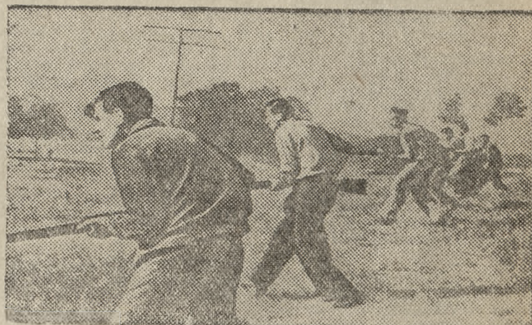
На снимке: Призывники и добровольцы проходят военное обучение.