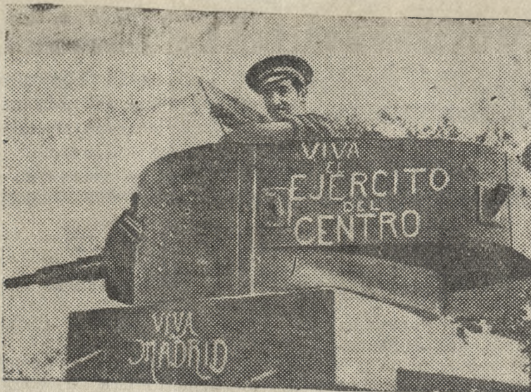
На сн: Танкист республиканской армии. На танке надпись: „Да здравствует Армия Центрального фронта“. Да здравствует Мадрид“.