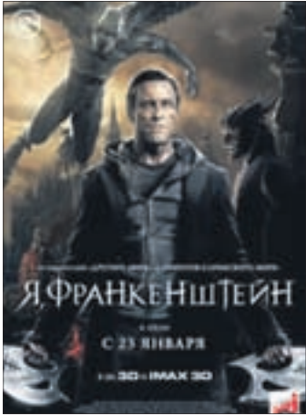
Я, ФРАНКЕНШТЕЙН Боевик (12+)