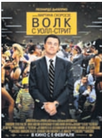
ВОЛК С УОЛЛ-СТРИТ Драма (16+)