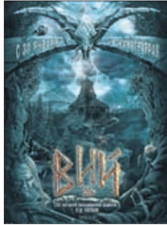
ВИЙ 3D Триллер (12+)