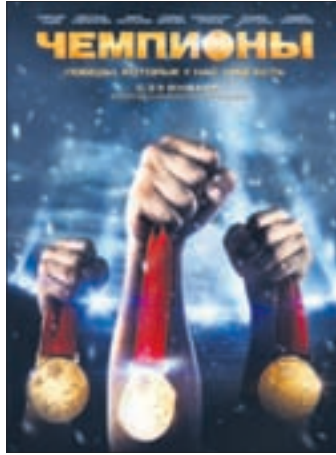
ЧЕМПИОНЫ Драма (0+)