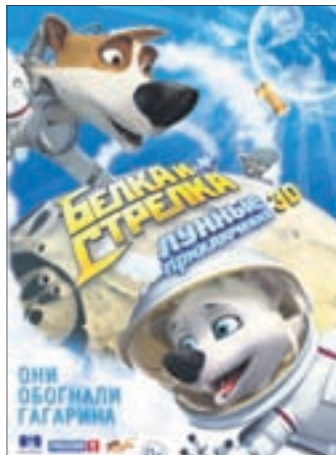
БЕЛКА И СТРЕЛКА: ЛУННЫЕ ПРИКЛЮЧЕНИЯ Мультфильм (0+)