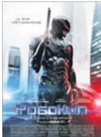
РОБОКОП Фантастика (12+)