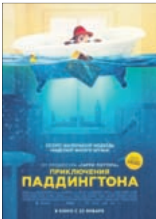
ПРИКЛЮЧЕНИЯ ПАДДИНГТОНА Комедия (0+)