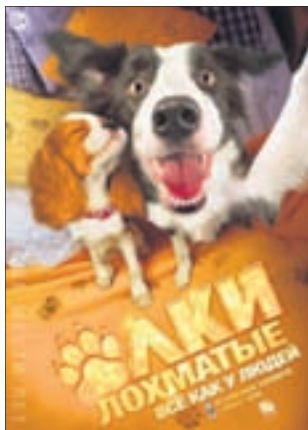
ЁЛКИ ЛОХМАТЫЕ Комедия (6+)