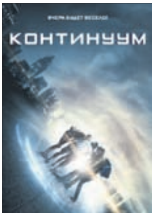
КОНТИНУУМ Триллер (16+)