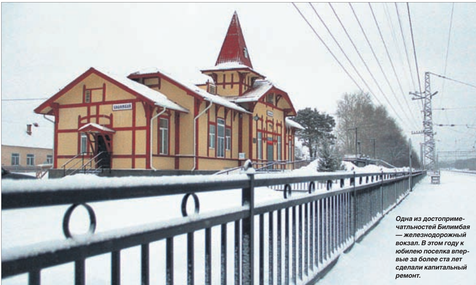
Одна из достопримечательностей Билимбае — железнодорожный вокзал. В этом году к юбилею поселка впервые за более ста лет сделали капитальный ремонт.