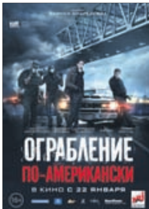
ОГРАБЛЕНИЕ ПО-АМЕРИКАНСКИ Триллер (16+)