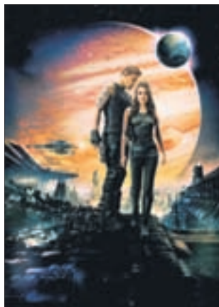
ВОСХОЖДЕНИЕ ЮПИТЕРА Фантастика (12+)