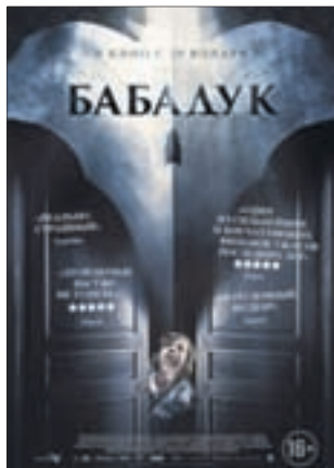
БАБАДУК Ужасы (16+)