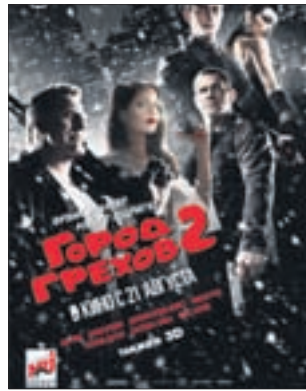
ГОРОД ГРЕХОВ 2: ЖЕНЩИНА, РАДИ КОТОРОЙ СТОИТ УБИВАТЬ Боевик (18+)