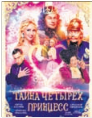
ТАЙНА ЧЕТЫРЕХ ПРИНЦЕСС Комедия (0+)