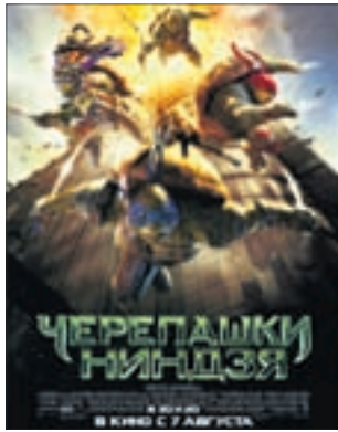
ЧЕРЕПАШКИ-НИНДЗЯ Комедия (6+)