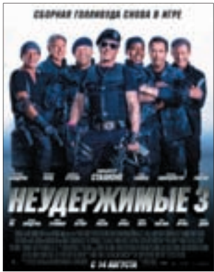
НЕУДЕРЖИМЫЕ 3 Боевик (12+)