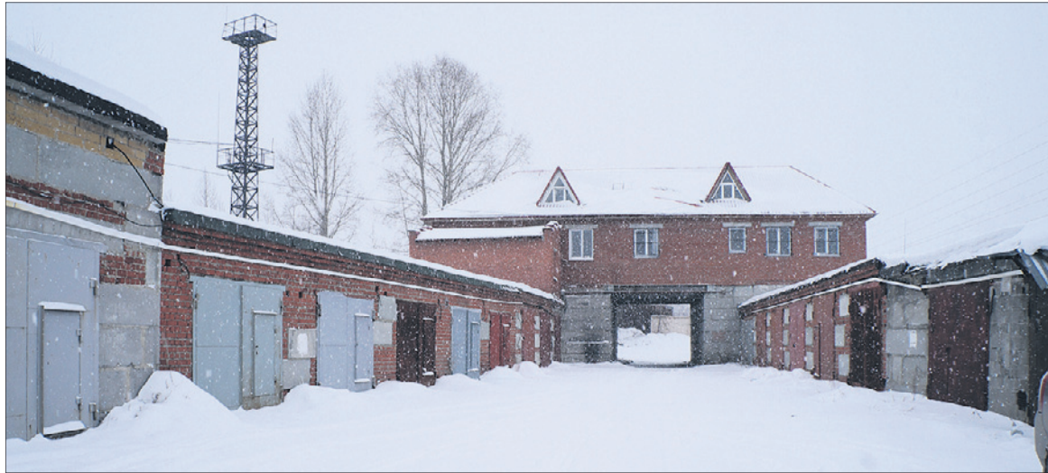
Гаражный кооператив «Сталь».

— 11 декабря я пришел на прием к начальнику УЖКХиС Марине Шолоховой. После этого к нам на место выезжали, взяли пробы во-