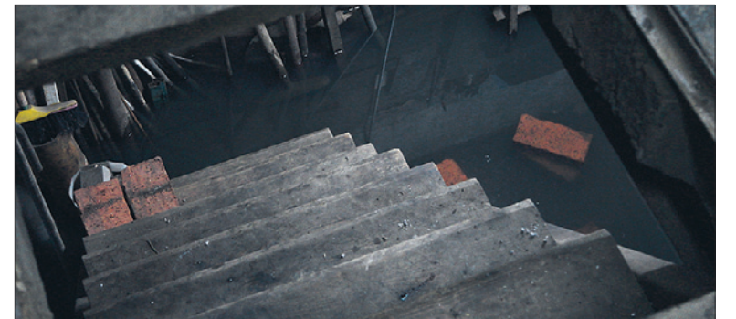
Гараж Владимира затоплен на 30 см.