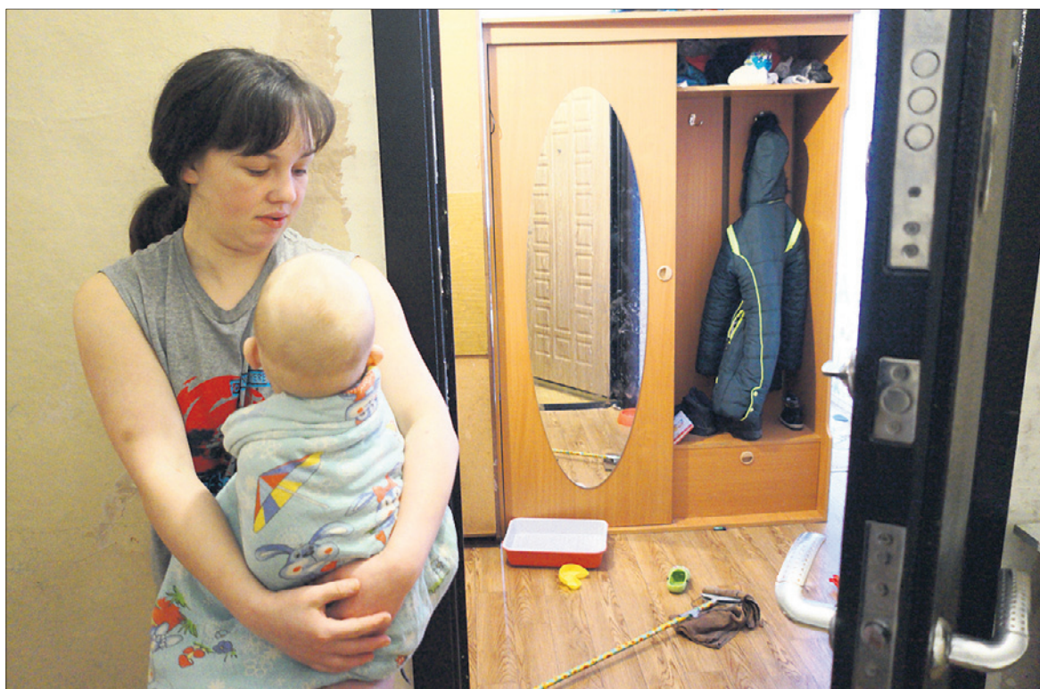
В бывшем женском общежитии много детей. По вечерам они все вместе бегают по коридорам.

шевую в качестве отхожего места и площадки для коротких, но, видимо, страстных, свиданий.