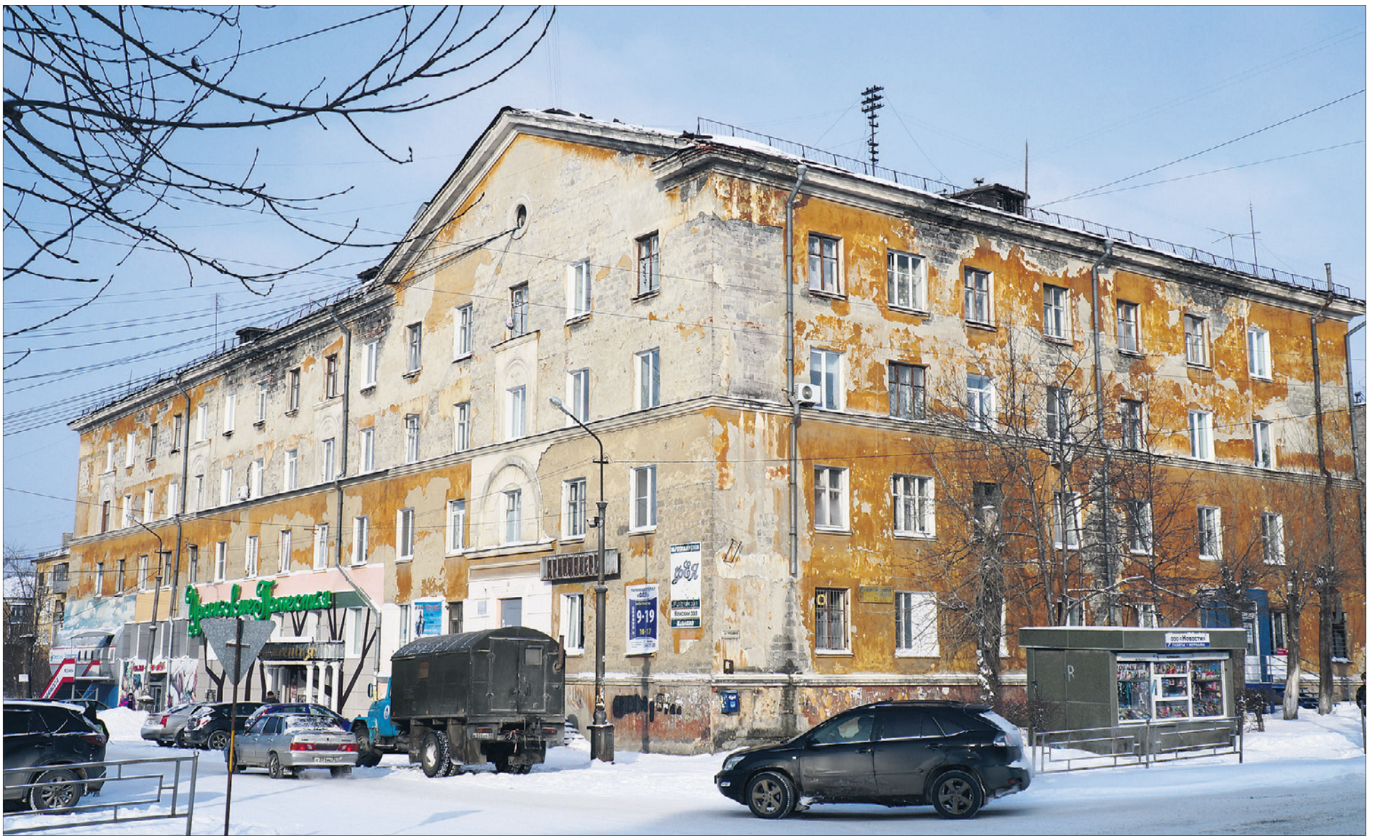
Здание на Герцена, 2/25, построенное в стиле сталинского ампира, давно нуждается в основательном ремонте.

Подготовила ЕКАТЕРИНА КАЛАДЖИДИ, ek@gorodskievesti.ru vk.com/id163408306