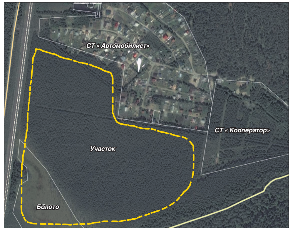
Желтым пунктиром отмечен участок, который Переверзев «выписал» из собственности муниципалитета в 2013 году.