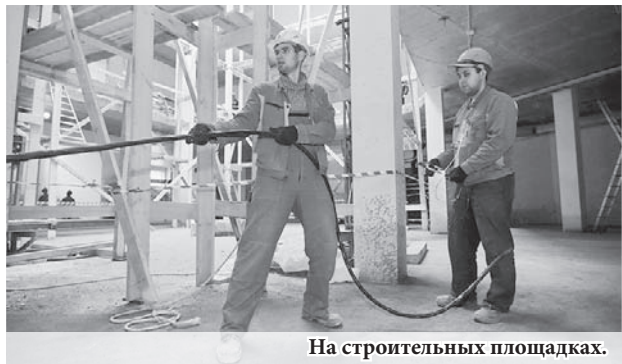
На строительных площадках.

Ещё одно направление работы правительства области – расселение ветхого и аварийного жилья. С 2013 года расселено более 12 тыс. человек. Ликвидировано 196 тыс. м 2 аварийного жилья. До 1 сентября 2017 года весь аварийный жилой фонд, признанный таковым по состоянию на 1 января 2012 года и входящий в реестр, должен быть полностью расселён.