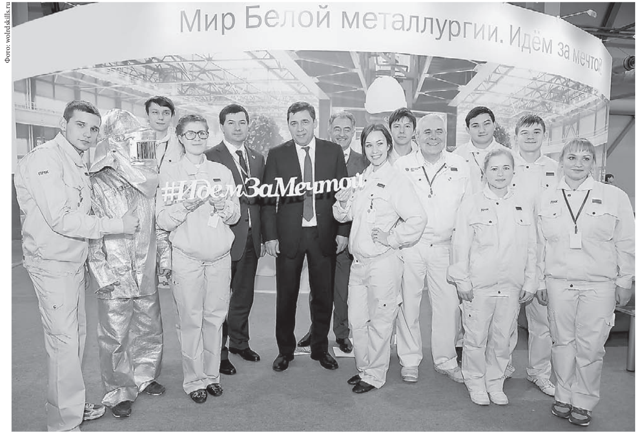
В регионе повышается мастерство специалистов по методике WorldSkills.

Один из резидентов технопарка – компания «НЕКСАН» планирует разместить высокотехнологичное производство промышленных теплообменников. Ещё один резидент – НПО «БиоМикроГели» – будет производить средства для очистки воды и твёрдых поверхностей от комплексных загрязнений, а также бытовую химию.