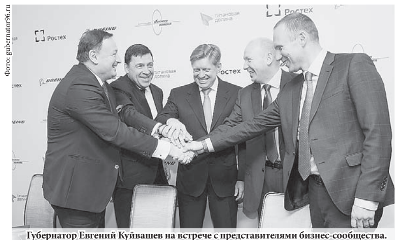
Губернатор Евгений Куйвашев на встрече с представителями бизнес-сообщества.

Губернатор дал органам власти региона два месяца на достижение первых результатов по выполнению «дорожной карты» по упрощению ведения бизнеса.