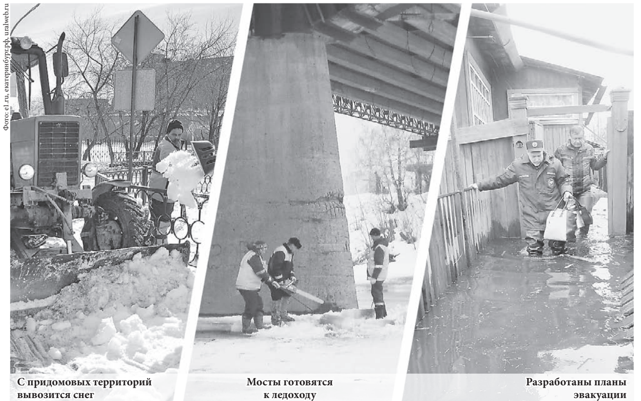
С придомовых территорий вывозится снег