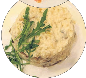
Рис с белыми грибами и кокосовыми сливками

Свежие шампиньоны моем, очищаем от кожицы и нарезаем ломтиками. Обжариваем на раскаленной сковороде с маслом до золотистого цвета, солим, перчим. Пока жарятся грибы, свежие помидоры моем, удаляем место прикрепления плодоножки, нарезаем ломтиками и складываем в миску, туда же выкладываем нашинкованный соломкой красный сладкий лук. К помидорам выкладываем грибы, салат сбрызгиваем соком лимона и оливковым маслом, перемешиваем и подаем на стол в салатнике, оформив зеленью.