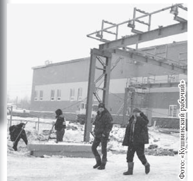
■ «Кушвинский рабочий»