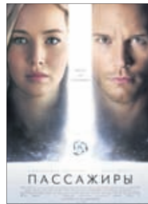
ПАССАЖИРЫ Фантастика (16+)

«Восход» (т. 66-74-45) «Сфера Синема» (т. 29-79-50)