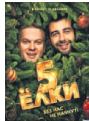
ЁЛКИ 5 Комедия (6+)