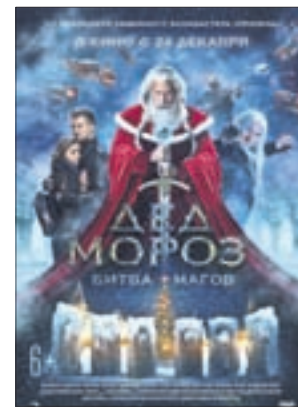
ДЕД МОРОЗ. БИТВА МАГОВ Фэнтези (6+)