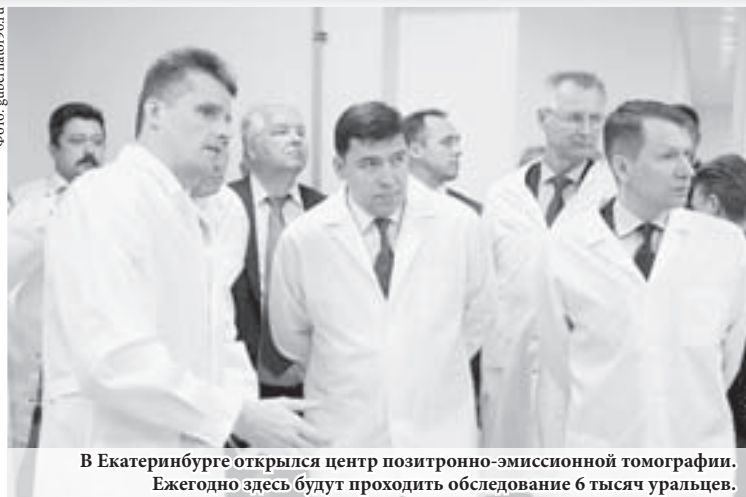
В Екатеринбурге открылся центр позитронно-эмиссионной томографии. Ежегодно здесь будут проходить обследование 6 тысяч уральцев.