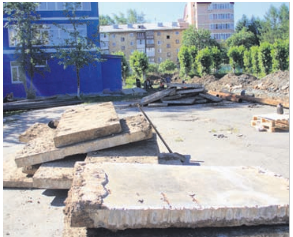
Фото Анны Неволіной