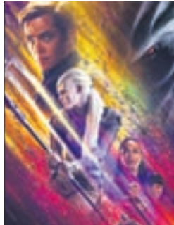
СТАРТРЕК: БЕСКОНЕЧНОСТЬ Фантастика (16+)