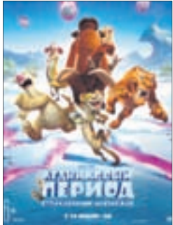
ЛЕДНИКОВЫЙ ПЕРИОД: СТОЛКНОВЕНИЕ НЕИЗБЕЖНО Мультфильм (6+)

«Восход» (т. 66-74-45) «Сфера Синема» (т. 29-79-50)