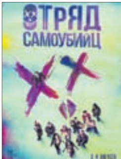
ОТРЯД САМОУБИЙЦ Фантастика (16+)