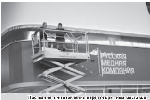
Последние приготовления перед открытием выставки