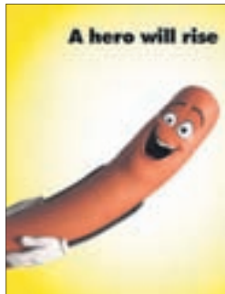
ПОЛНЫЙ РАСКОЛБАС Мультфильм (18+)