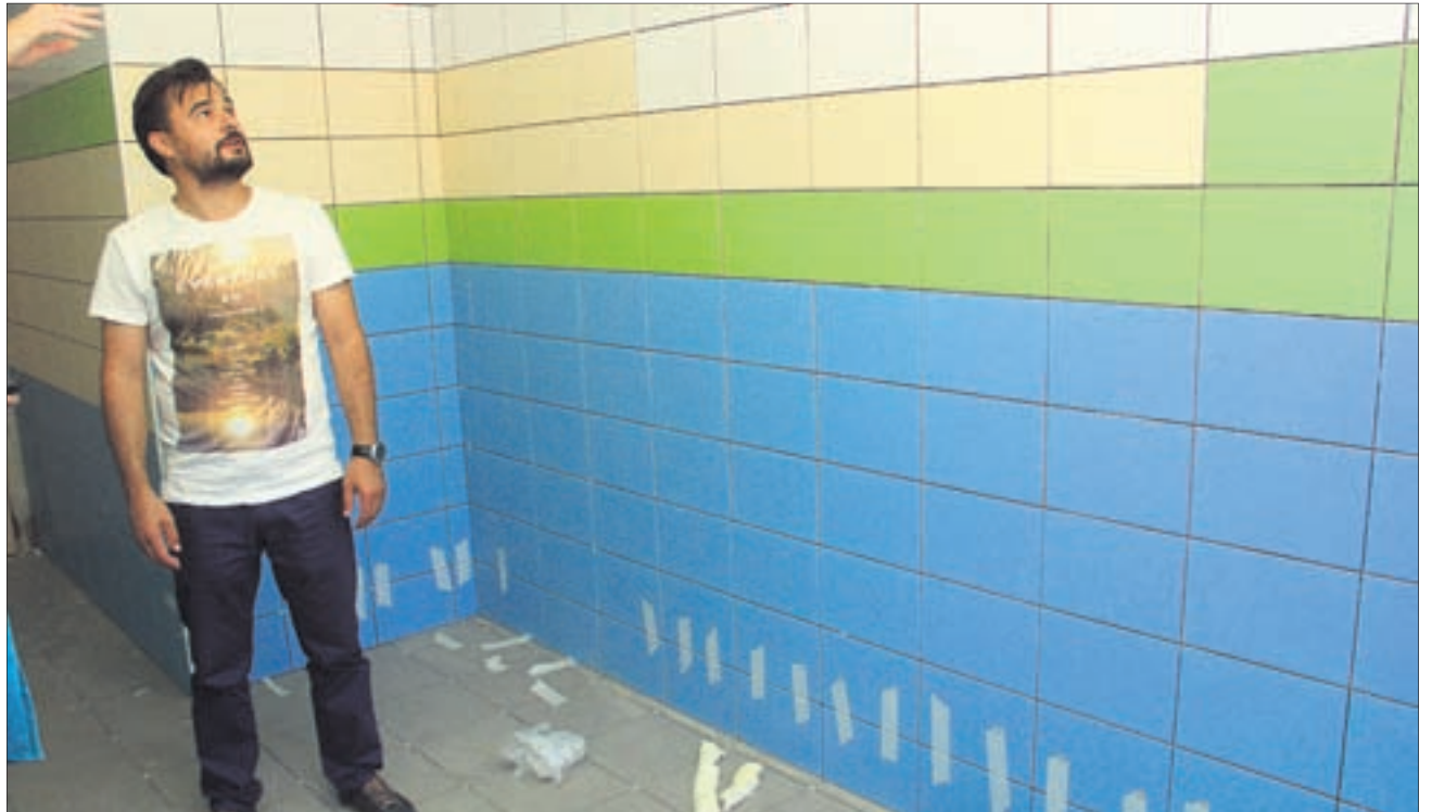
Фото Анны Неволіной