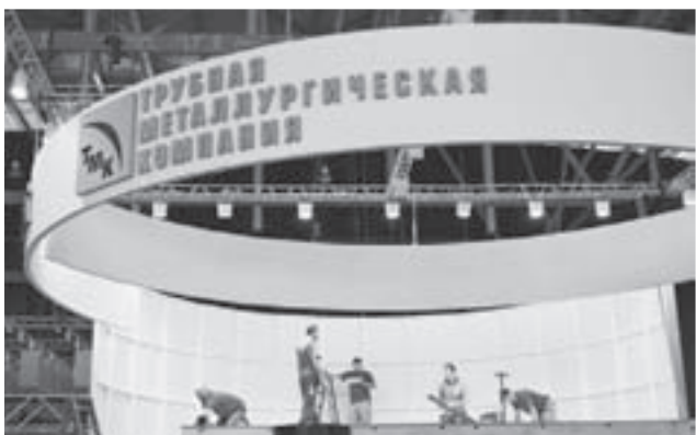
Трубная металлургическая компания в 1-м павильоне на видном месте

В дни проведения выставки организованы специальные автобусные рейсы для посетителей выставки. Городские автобусы будут курсировать в даты выставки 11-14 июля: От станции метро «Ботаническая» до МВЦ «Екатеринбург-ЭКСПО» с 09:00 до 19:30 с интервалом 20 минут. От МВЦ «Екатеринбург-ЭКСПО» до станции метро «Ботаническая» с 09:35 до 20:00 с интервалом 20 минут.