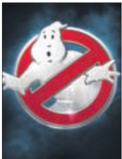
ОХОТНИКИ ЗА ПРИВИДЕНИЯМИ Фантастика (16+)