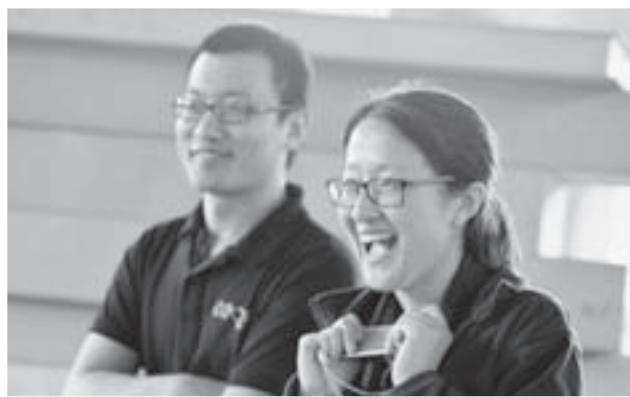
Гости из Китая не скрывают эмоций от увиденного на Иннопроме