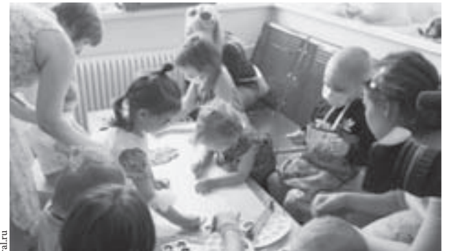
В центре детской онкологии и гематологии ОДКБ №1 в рамках проекта «Искусство против рака» прошло увлекательное занятие, это помогает отвлечь маленьких пациентов от больничных будней.

Первое в Екатеринбурге и восьмое в Свердловской области отделение паллиативной помощи открылось в ЦГБ № 2 имени Александра Миславского.