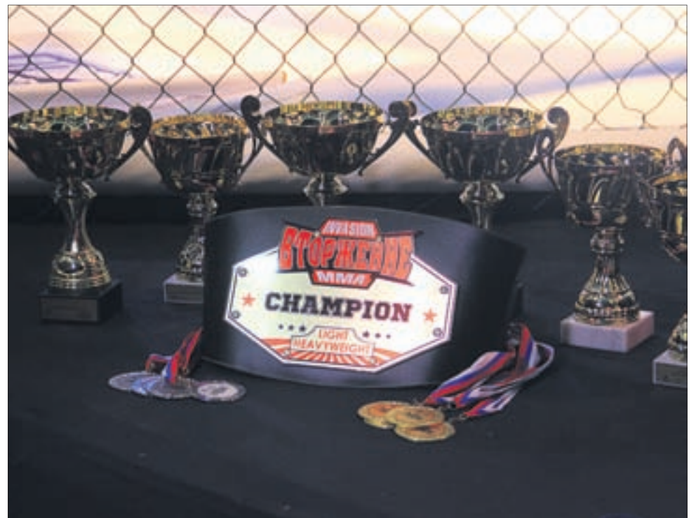
Главная награда — пояс чемпиона турнира «Вторжение» — осталась в Первоуральске.