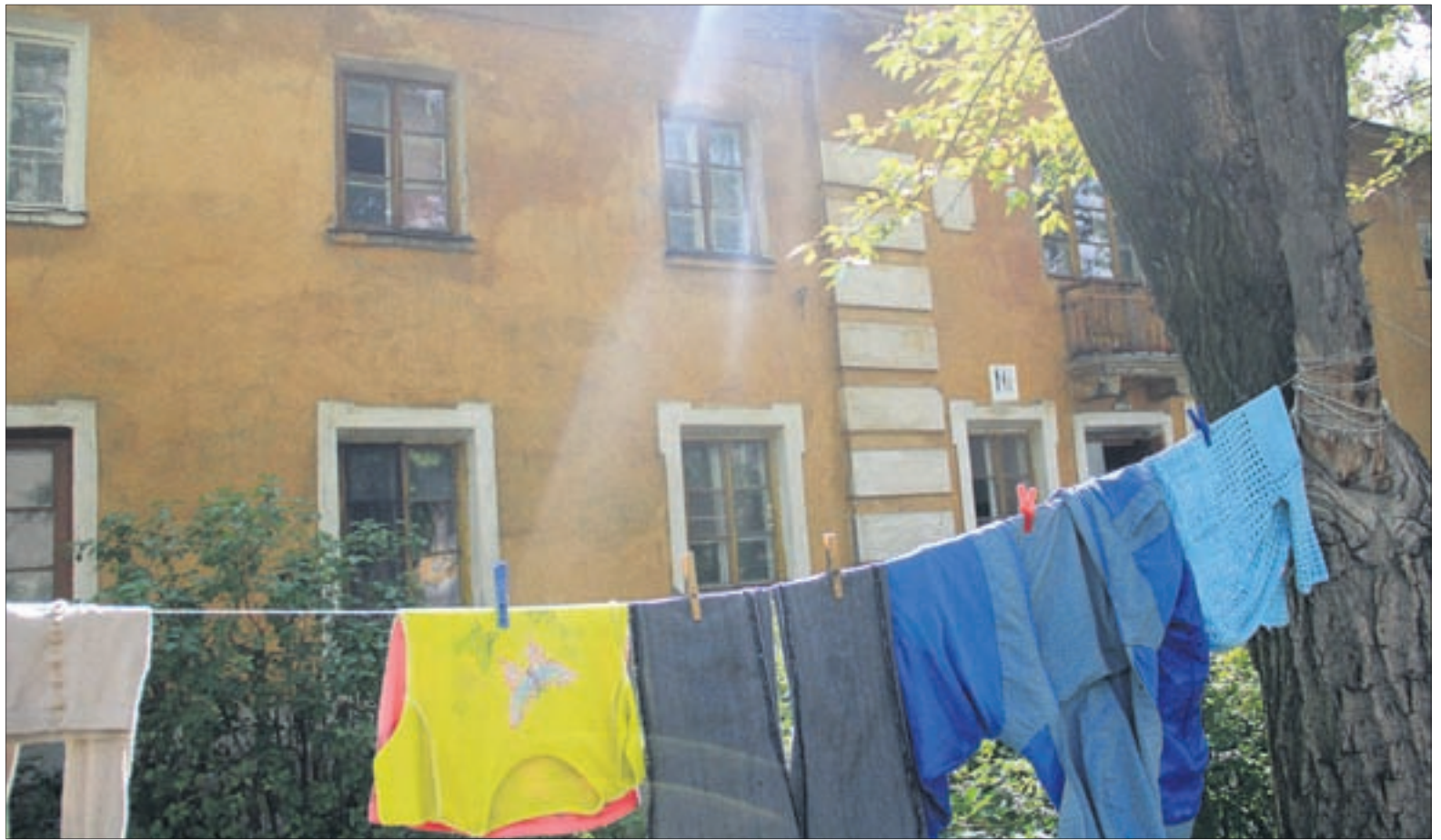
Дома поствоенной постройки еще крепкие, но очень запущенные — капитальный ремонт необходим.