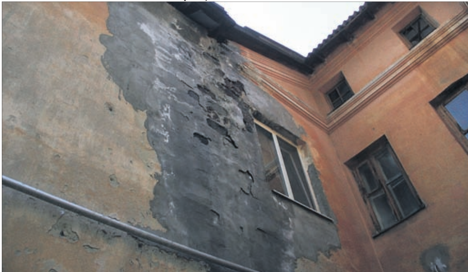
Стену на Папанинцев, 22 ремонтировали недавно, однако новая штукатурка отвалилась кусками, а фасад продолжает разрушаться.