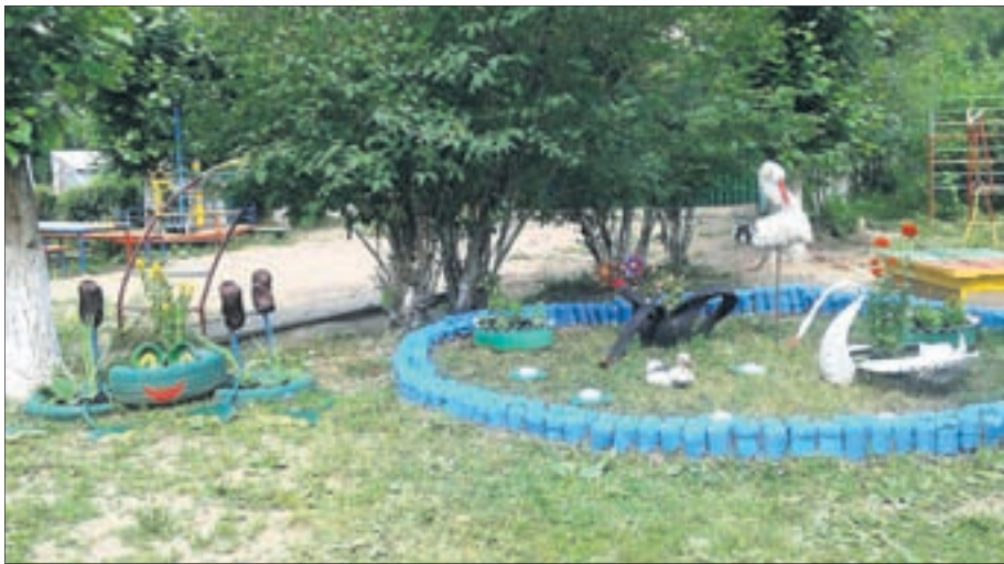
Первый участник конкурса — филиал МАДОУ «Детский сад №3» - «Детский сад №21»