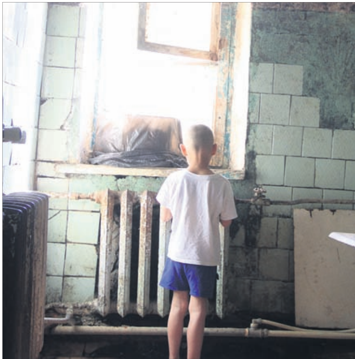
У жителей общежития очень простые радости: чтоб была вода, тепло, а с потолка, по возможности, не лились фекалии.