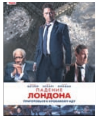
ПАДЕНИЕ ЛОНДОНА Боевик (16+)