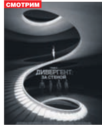
ДИВЕРГЕНТ, ГЛАВА 3: ЗА СТЕНОЙ Фантастика (12+)