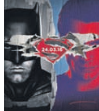
БЭТМЕН ПРОТИВ СУПЕРМЕНА: НА ЗАРЕ СПРАВЕДЛИВОСТИ Фантастика (12+)