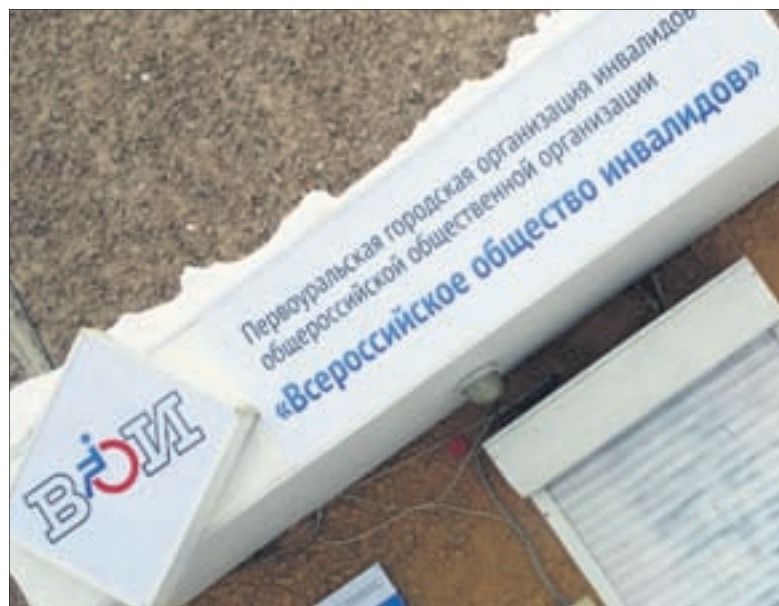
Фото из архива редакции