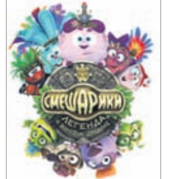
СМЕШАРИКИ. ЛЕГЕНДА О ЗОЛОТОМ ДРАКОНЕ Мультфильм (6+)