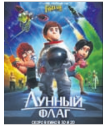
ЛУННЫЙ ФЛАГ Мультфильм (6+)