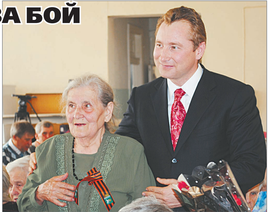
Для мэра важны все ветераны

После войны 27 лет женщина проработала на БЗСК, была экономистом и нормировщиком, поэтому встреча ветеранов-заводчан ей особенно дорога. На прошлой неделе в актовом зале лицея №3 «Альянс» чествовали тружеников тыла и ветеранов Великой Отечественной войны, которые работали на БЗСК. Еще 91 юбилейная медаль нашла там своего героя.