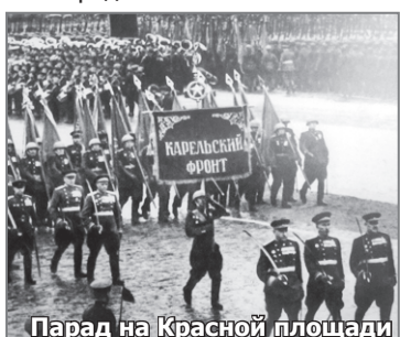
Парад на Красной площади

На черно-белой фотографии изображена молодая девушка в военной форме, в пилотке. Снимок был сделан чисто случайно. Неподдалеку от нашего аэродрома специалисты производили фотосъемку местности. Потом парни прибыли на аэродром, встретили девушек-оружейниц и предложили сфотографировать. Мы с радостью согласилась. Эта