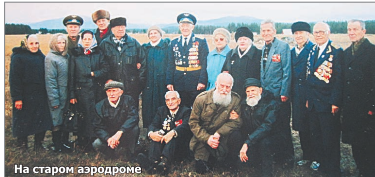
На старом аэродроме

– С подружкой Тоней мы совсем немного отошли от аэродрома – прогуляться по лесу. Вдруг – оглу-