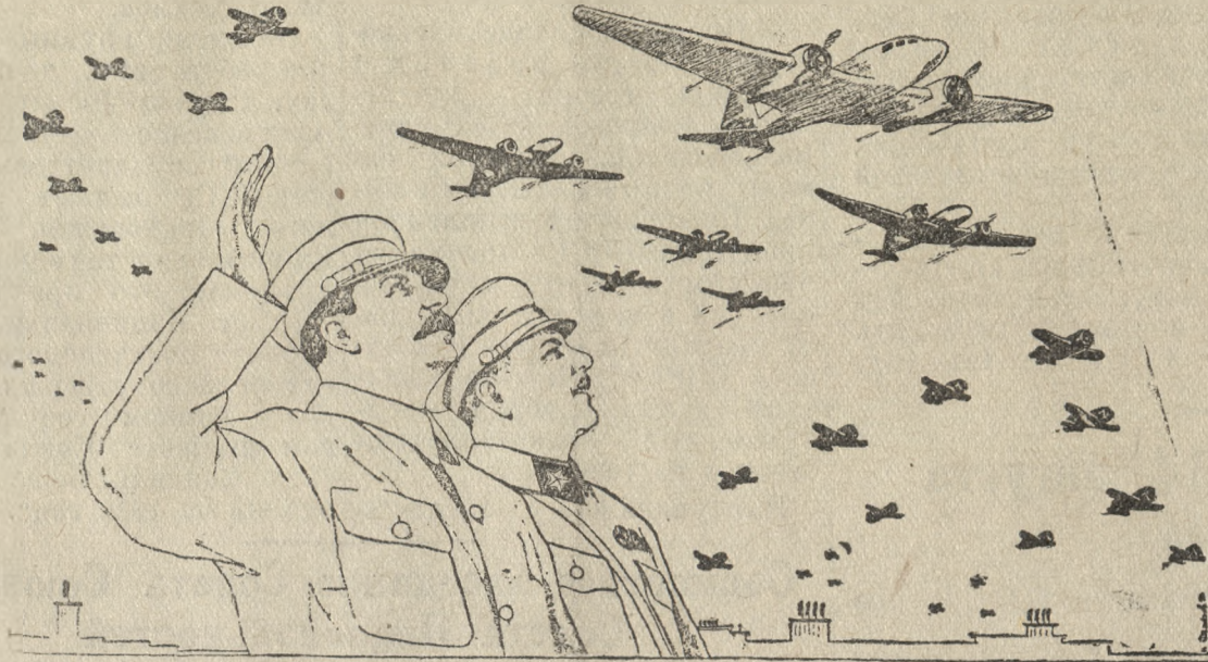
Перерисовка художника Н. Денисова с плаката художника Н. Денисова и Н. Ватолиной.

Так будет с каждым—кто посмеет посягнуть на советскую родину. Такова воля стосемидесяти миллионов советского народа. И бесстрашные, мужественные летчики—сталинские соколы, гордо рея ввышине, дадут сокрушительный удар по врагу.