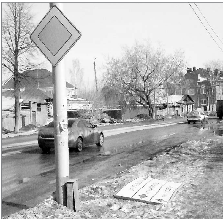
Как ветром сдуло