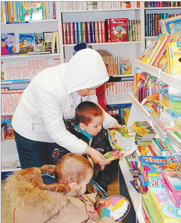
– Мама, купи мне эту книжку!

В НАШЕМ городе самой читающей категорией населения являются малыши и их родители: детская развивающая литература пользуется большим спросом. Далее по степени популярности идут книги о кулинарии, увлечениях, учебная, художественная и юридическая литература. Такую тенденцию выявили продавцы книжного магазина ООО «Дом книги».