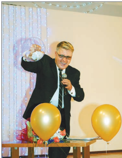
Среди культработников провели праздничную лотерею