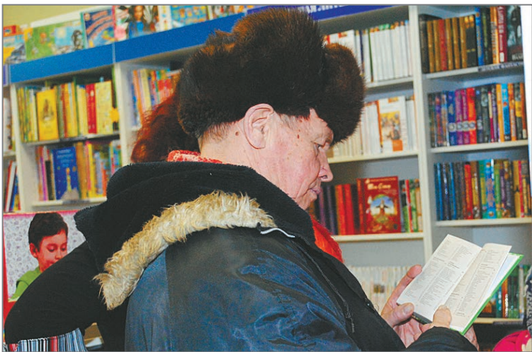
Покупатели зачитываются не отходя от прилавка

В НАШЕМ городе самой читающей категорией населения являются малыши и их родители: детская развивающая литература пользуется большим спросом. Далее по степени популярности идут книги о кулинарии, увлечениях, учебная, художественная и юридическая литература. Такую тенденцию выявили продавцы книжного магазина ООО «Дом книги».