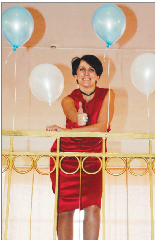
«Праздник – во!»