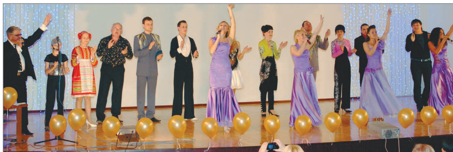
С праздником, культурные наши!