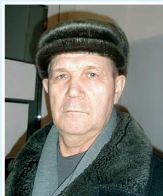
Владимир Николаевич, 63 года:

– Защитниками Отечества, думаю, могут быть как мужчины, так и женщины. Просто представителям сильного пола это «сподручнее», ведь они обладают недюжинной силой и разумным спокойствием. Защищать страну надо не только в лихую годину, но и каждый день – думать о ее будущем, бороться за справедливость, делать ежедневно жизнь лучше. Не такая уж простая задача, с ней справятся только настоящие защитники.