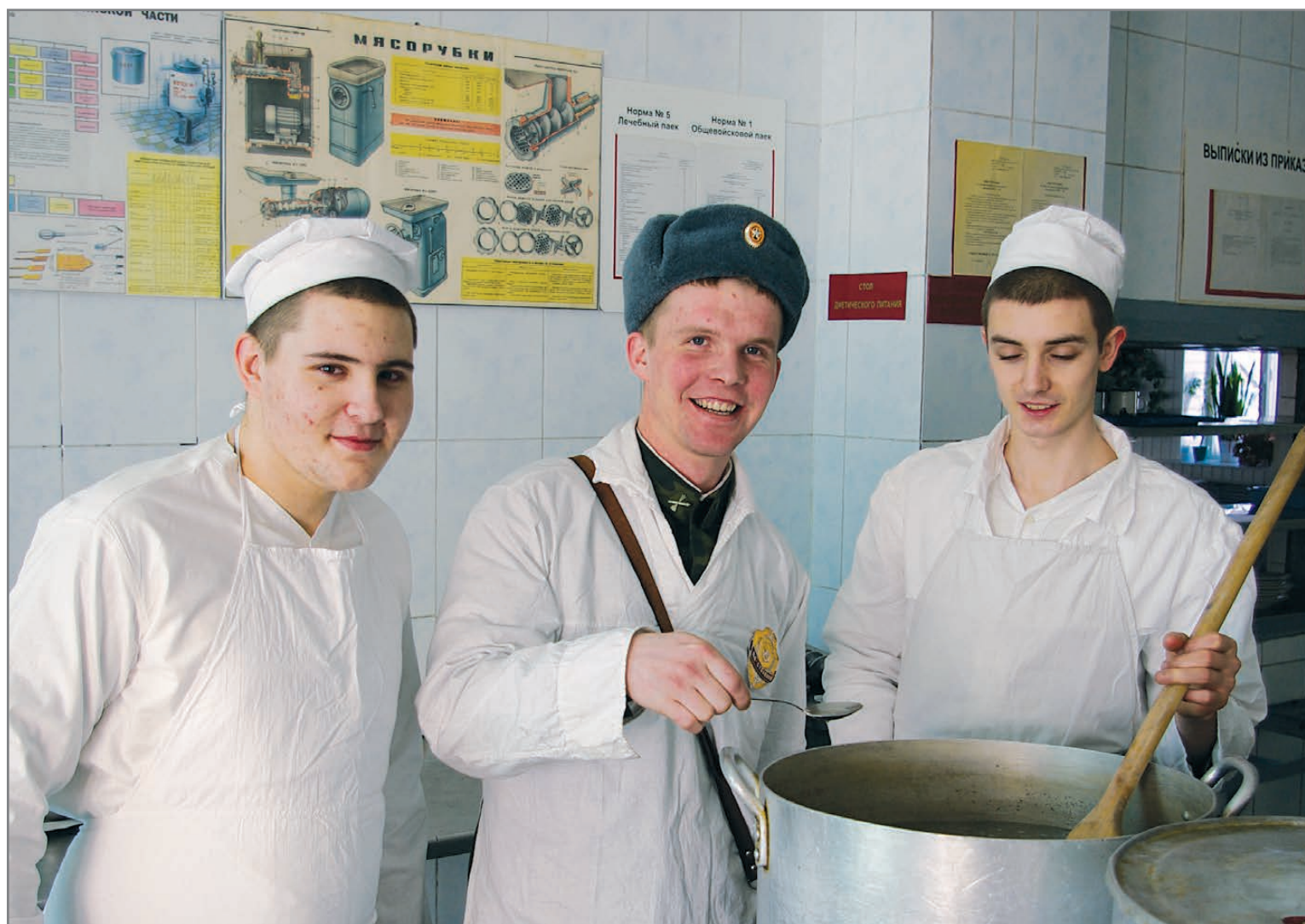
Солдаты березовской в/ч 92851 готовят праздничный обед