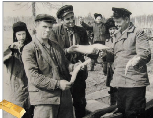
Щука попалась знатная!