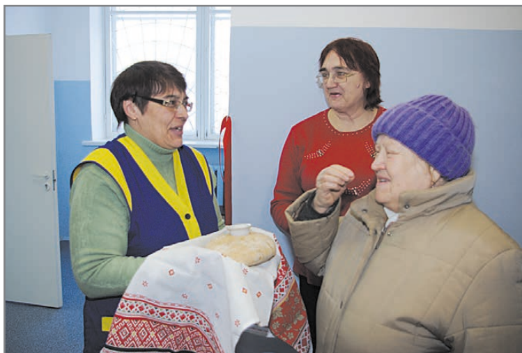
Добро пожаловать, гости дорогие!

проведен ремонт в Ключевске, на него уже выделены деньги, далее в списке Кедровка, Лосинный и Монетный. Конечно, нужно модернизировать отделение