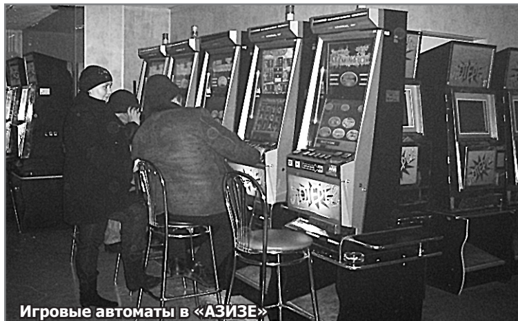
Игровые автоматы в «АЗИЗЕ»

ДИСКО-БАР «Дорога в рай», кафе «Азиза», закусочная «У Камала», бар «Бильярд», кафе «Бездна», ночной клуб «Светофор» — вот заведения, в которых разворачивается ночная жизнь города Березовского. Именно в них открыли ночную «охоту» на детей, которым здесь не место, общественные организации и подразделение по делам несовершеннолетних в ночь на 30 января. Без предупреждения и с видеокамерами в руках.