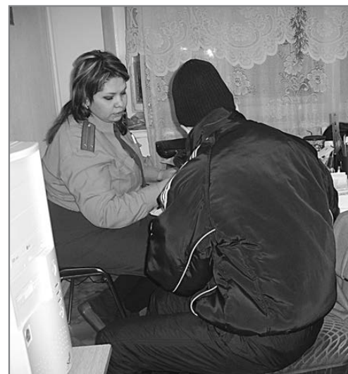
Пиво в «Раю» — дорога в милицию

Каждую последнюю пятницу месяца, начиная с февраля, вы также можете прийти на прием в ТКДНиЗП по адресу: ул. Строителей, 8, с 16.00 до 18.00 и рассказать о подобных фактах лично.