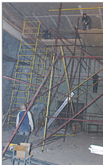
Восстановление зала начали с потолка

Скрестим пальцы: очередная городская мечта близка к исполнению. Ждем с нетерпением!