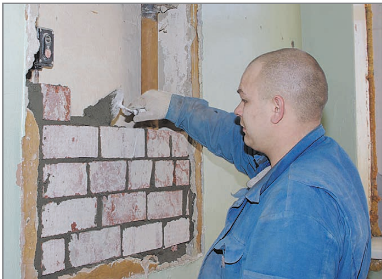
Отделочники работают не покладая рук

Татьяна ЧУДИНОВСКИХ