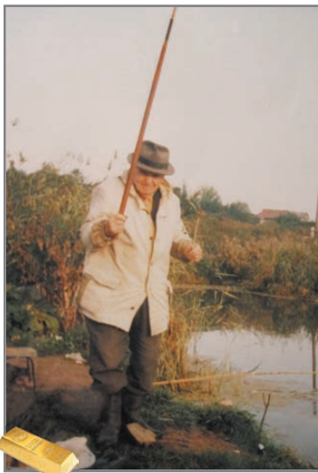
44-ый квартал. 2006 год

– Здесь меня пригласили в ЦНИИПП (Центральный научно-исследовательский институт пневмокоинозов). Думал, не больше года там поработаю, а задержался на целых 13 лет, – продолжает рассказ наш герой.