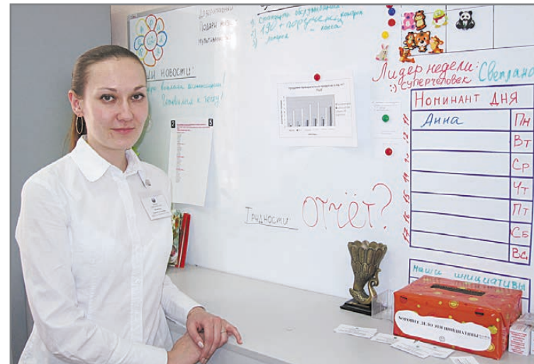
«Доска результативности»: «лаборатория» планирования, «мерило» успеха и «индикатор» климата в коллективе

К концу 2010 года новые технологии будут внедрены во всех подразделениях, расположенных на территории Свердловской, Курганской, Челябинской областей и Республики Башкортостан. Сотрудники же Березовского отделения Сбербанка уже доказали, что способны быстро претворять в жизнь новые идеи и эффективно обслуживать клиентов. Подтверждением этому стал и приезд на прошлой неделе в наше отделение специалистов Среднерусского банка Сбербанка России из Москвы для обмена передовым опытом.