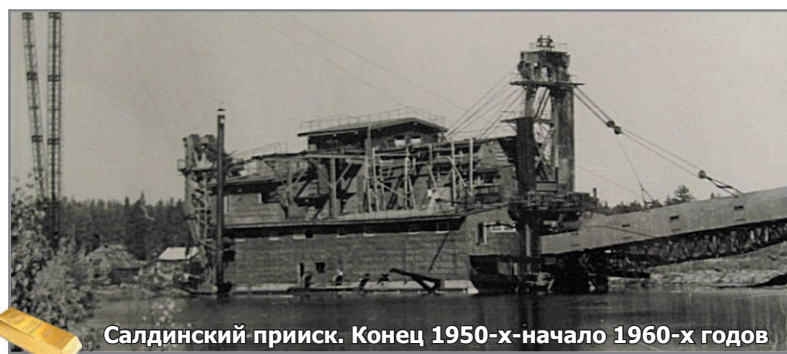
Салдинский прииск. Конец 1950-х-начало 1960-х годов