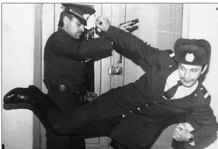
Обучение самбо младшего сотрудника

Школа № 23, что в Кедровке, носит имя В.Чечвия. Здесь ежегодно проходит вахта памяти, посвященная его героическому подвигу. И, если в родном поселке одна из улиц будет носить имя Героя, это будет нашей благодарностью за его подвиг.