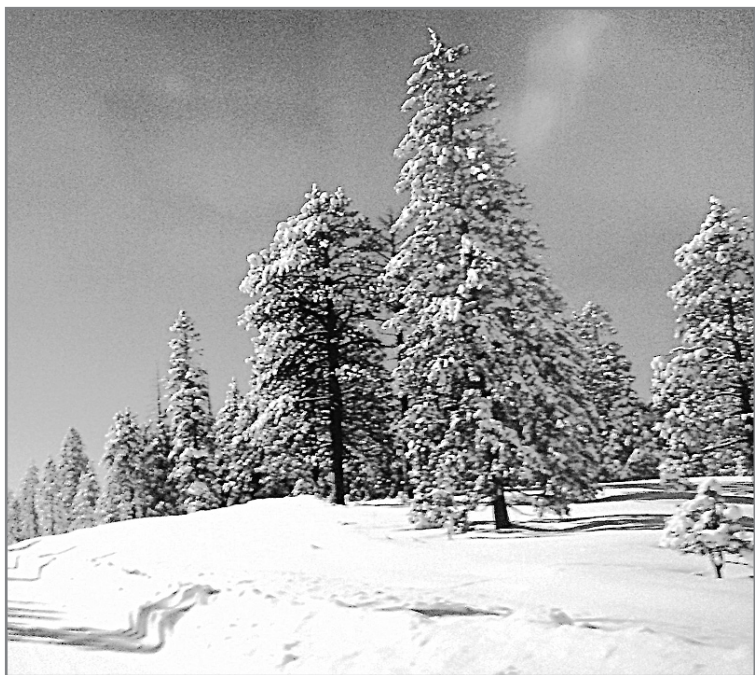
Мороз и солнце, день чудесный...