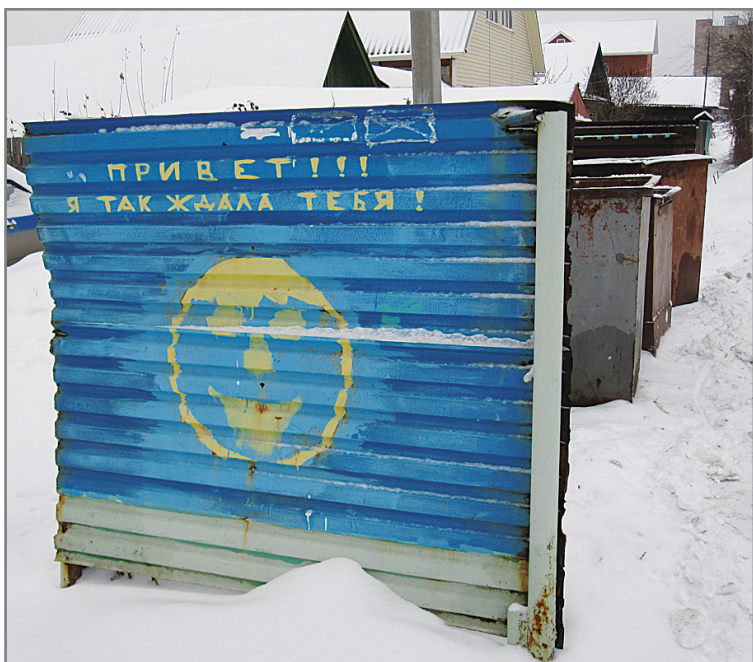
...а ты выбросил мусор у подъезда