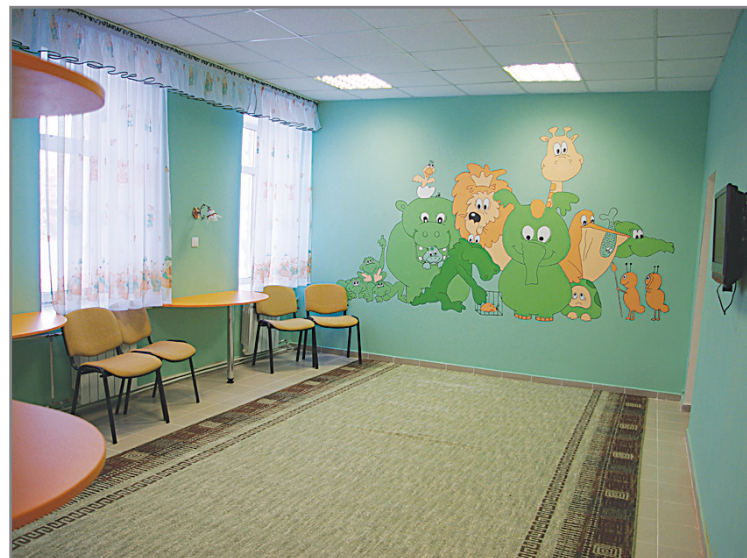
Все готово для игры...

Новый год в инфекционном отделении встретили восемь ребят, оставшиеся без кровя и родителей. 31 декабря к ним приходил Дед Мороз, поздравил с праздником и раздал сладкие подарки. Остальные десять праздничных дней мальчишки и девчонки скучали в серых больничных палатах, а красивое и уютное, специально отремонтированное для них помещение было на замке. Так где им было бы лучше?